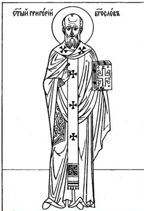
Святитель Григорий Богослов, архиепископ Константинопольский, родился около 329 года в

Блаже́нны от канoна свята́го, песни 3-я и 6-я. Прокі́мен, глас 1: Уста́ мой возглаго́лют премудро́сть, / и поуче́ние се́рдца моего́ разу́м. Стих: Услы́шите сия́, вси язы́цы, внуши́те, вси, живу́щии по вселенней. Апóстол к Коринфя́ном, зача́ло 151. Аллилу́ия, глас 2: Внемлі́те, лю́дие Мой, зако́ну Моему́, / приклоні́те у́хо ва́ше во глаго́лы уст Мойх. Ева́нгелие от Иоáнна, зача́ло 36. Прича́стен: В па́мь вѣчную: На трапѣзе утеше́ние бра́тнн. И чтем житіе́ свята́го.