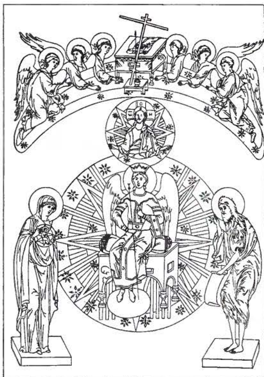
Новгородская икона Софии Премудрости Божией