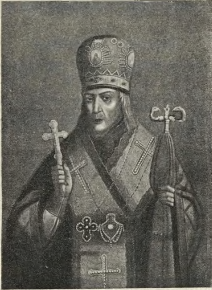
Святитель Іоасафъ Българодскій.