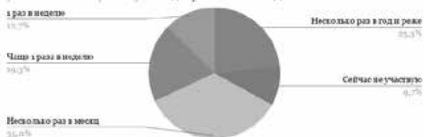
Рис. 2 — Вовлеченность в волонтерскую деятельность

Таким образом, мы видим, что большинство респондентов состоит и действует в рамках определенной организации или объединения. Это хороший показатель для данного исследования, так как мы изучаем возможности лично-ориентированного подхода в рамках организации. Частота волонтерской деятельности также достаточно регулярная — хотя бы несколько раз в месяц участвуют в волонтерской деятельности около 70 % респондентов. Опыт участия в волонтерской деятельности разделит участников на несколько категорий, которые примерно соотносятся друг с другом. Всё же определим некоторую тенденцию — около 60 % респондентов имеют малый опыт участия в волонтерской деятельности (от 0 до 3 лет).