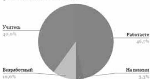
Рис. 1 — Социальная принадлежность