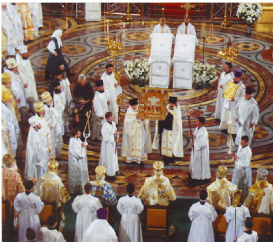
Прославление новомучеников и исповедников Российских Храм Христа Спасителя 20 августа 2000 года ЦИА ПСТГУ