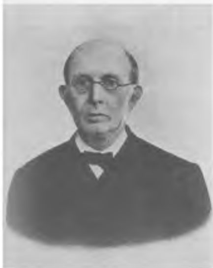
К. П. Победоносцев, обер-прокурор Святейшего Синода (24.04.1880—19.10.1905)