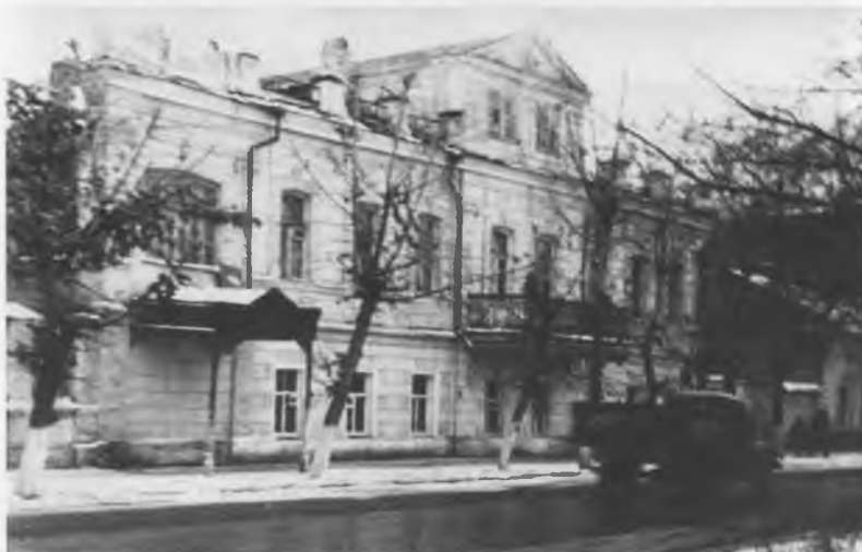
Дом купца Степанова в Астрахани, № 40 по Красной набережной реки Кутума (это же владение выходит на ул. Свердлова под № 45), в котором в 1918 г. помещалась ЧК. Во дворе дома, в складочном помещении, превращенном в тюремную камеру, содержались арестованные архиепископ Митрофан и епископ Леонтий (фон Вимпфен); здесь же они и расстреляны