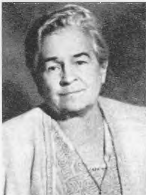
Ольга Леонардовна Книппер-Чехова