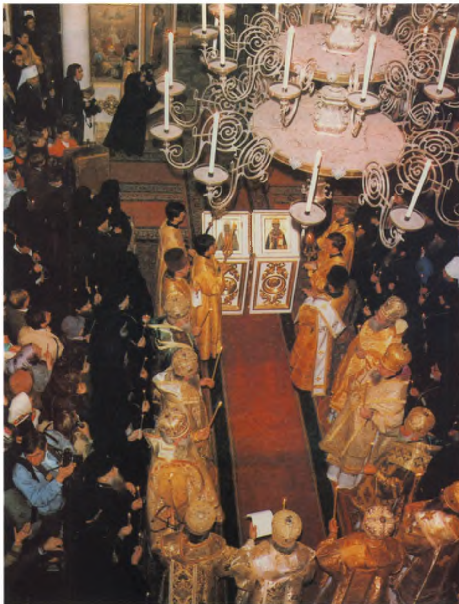
Троицкий собор Московского Свято-Данилова монастыря 9 октября 1989 года. Прославление в лике святых Всероссийских Патриархов Иова и Тихона