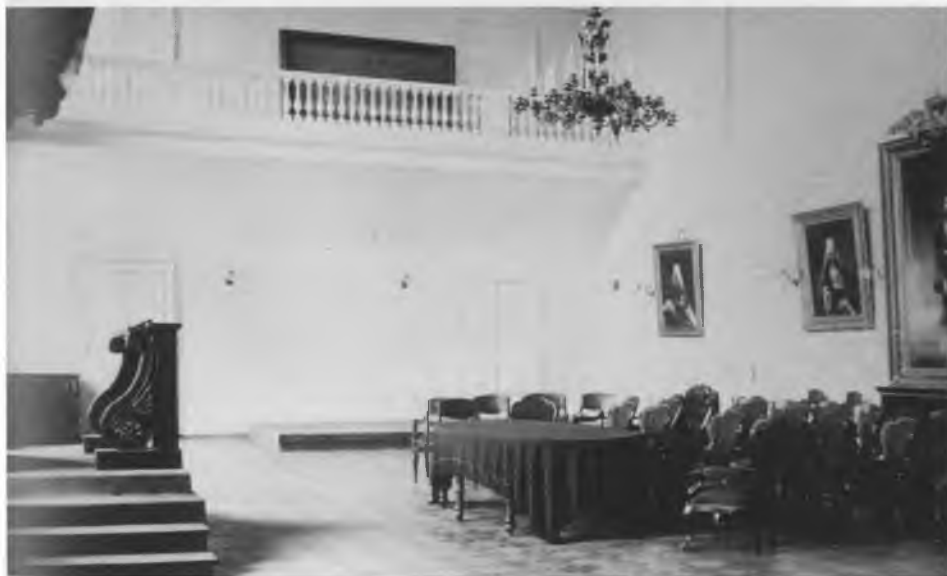
Актовый зал Санкт-Петербургской Духовной Академии