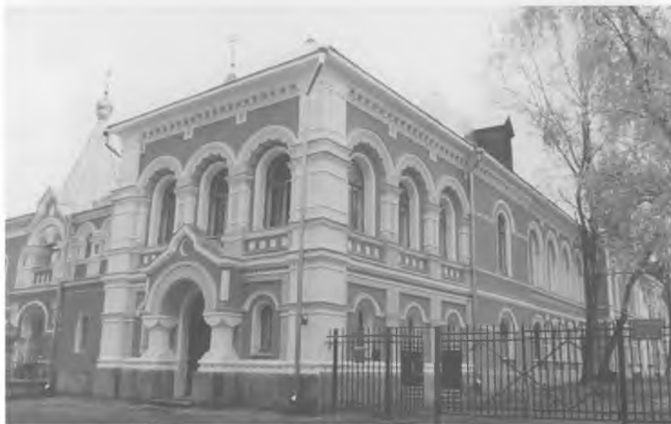
Вид на митрополичьи палаты со стороны надвратного корпуса Троицкого подворья Современная фотография