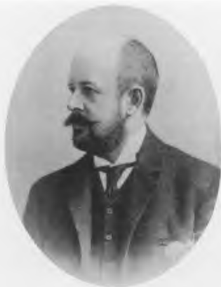
П. П. Извольский, обер-прокурор Святейшего Синода (27.07.1906—05.02.1909)