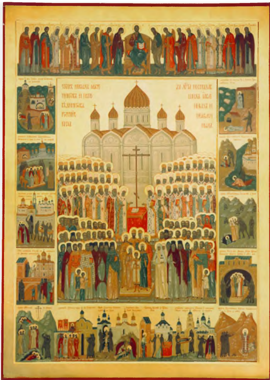
Икона «Собор новых мучеников и исповедников Российских явленных и неявленных», написанная иконописцами ПСТГУ для канонизации на Юбилейном Архиерейском Соборе Русской Православной Церкви 20 августа 2000 г.