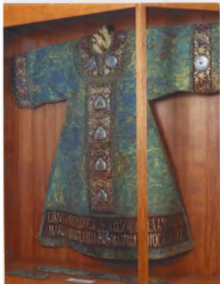
Саккос Святителя Тихона