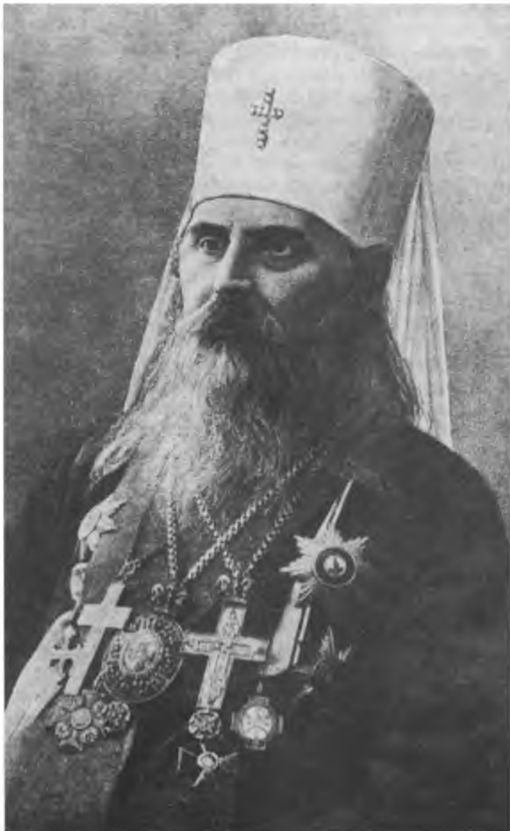
Митрополит Питирим (Окнов)