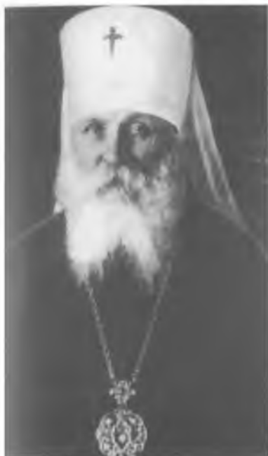
Митрополит Вениамин (Федченков) ЦИА ПСТГУ