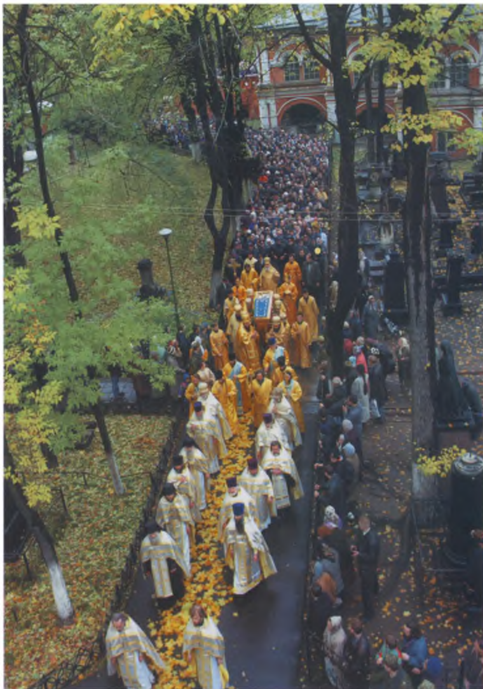
Перенесение мощей святителя Тихона