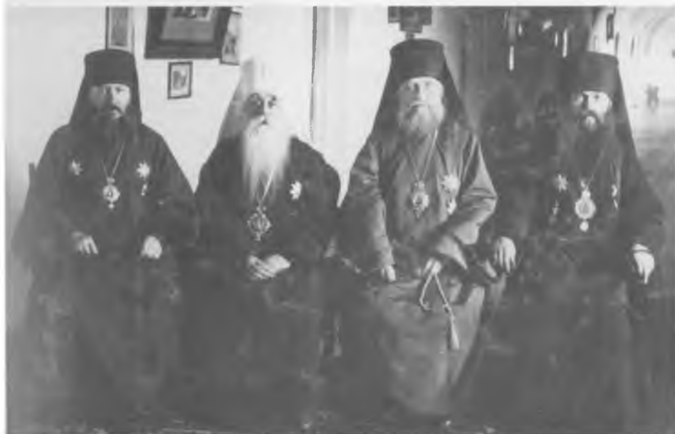
Высокопреосвященный митрополит Киевский и Галицкий Флавиан (Городецкий) в гостях у архиепископа Виленского и Литовского Тихона

Слева направо: архиепископ Гродненский и Брестский Михаил (Ермаков), митрополит Киевский и Галицкий Флавиан (Городецкий), архиепископ Виленский и Литовский Тихон и епископ Белостокский Владимир (Тихоницкий)