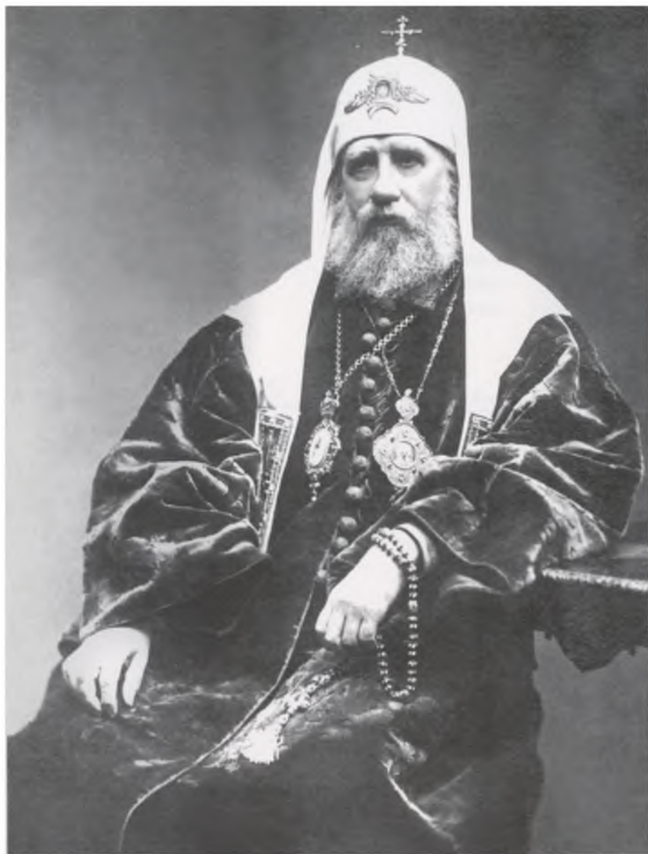
Metropolitan Nanniyah Menden in Paris.