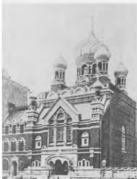
Николаевский кафедральный собор в Нью-Йорке, построенный при епископе Тихоне в 1903 г. В настоящее время — подворье Московской Патриархии