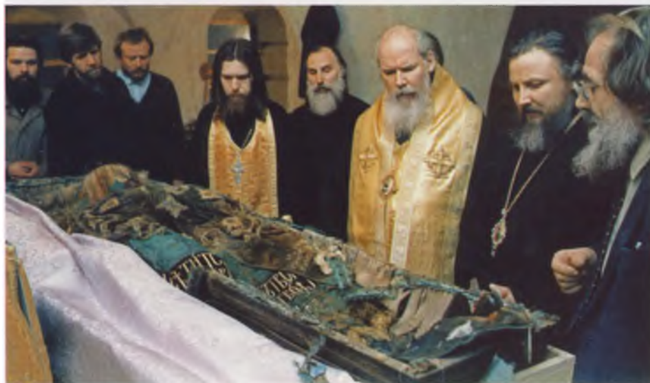
Святейший Патриарх Алексей II перед обретенными мощами святителя Тихона ЦИА ПСТГУ