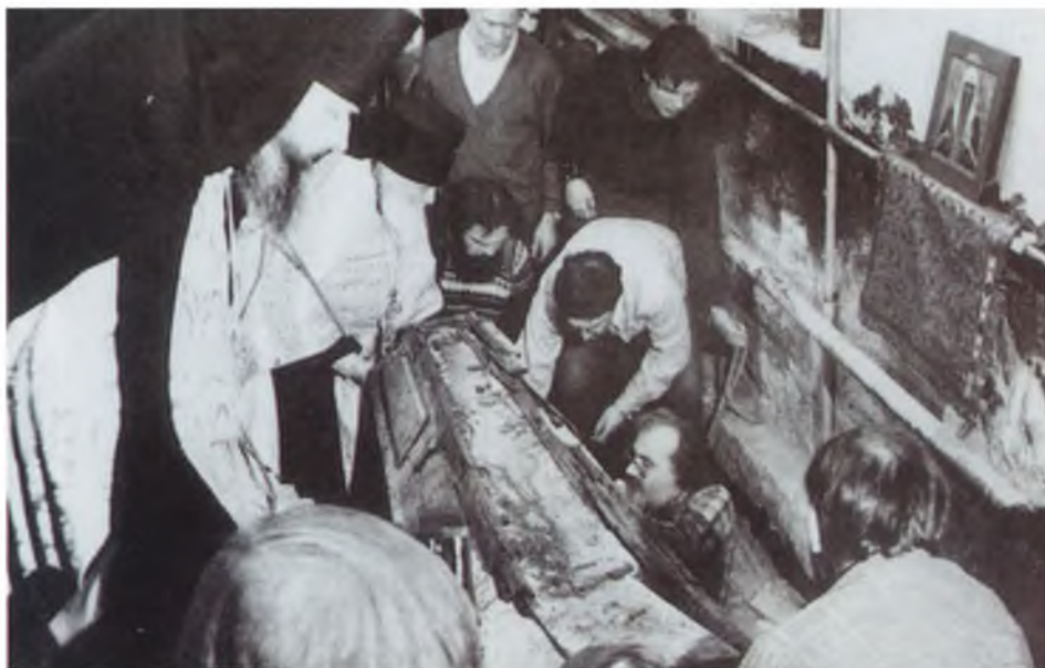
Обретение мошей св. Патриарха Тихона в Малом соборе Донского монастыря