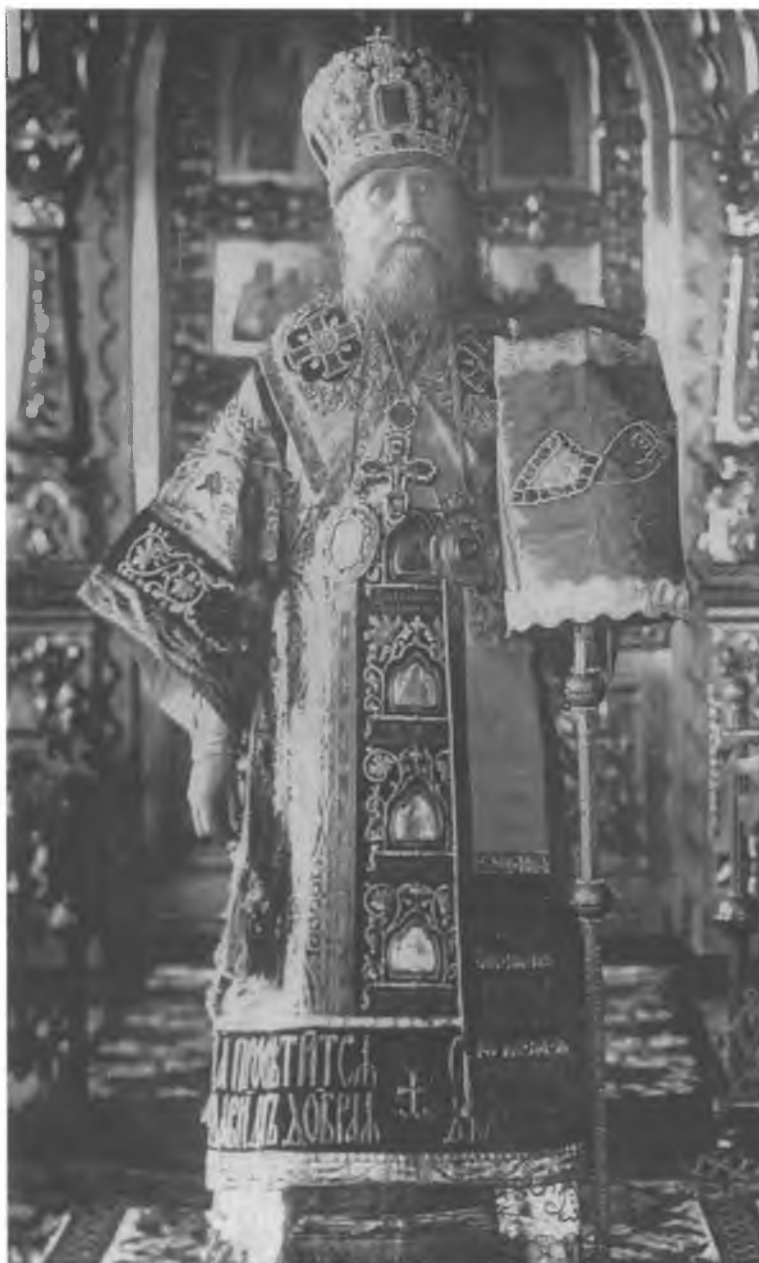
Святейший Тихон, Патриарх Московский и всея России в Успенском соборе Кремля в день возведения на Патриарший Престол 21 ноября 1917 года