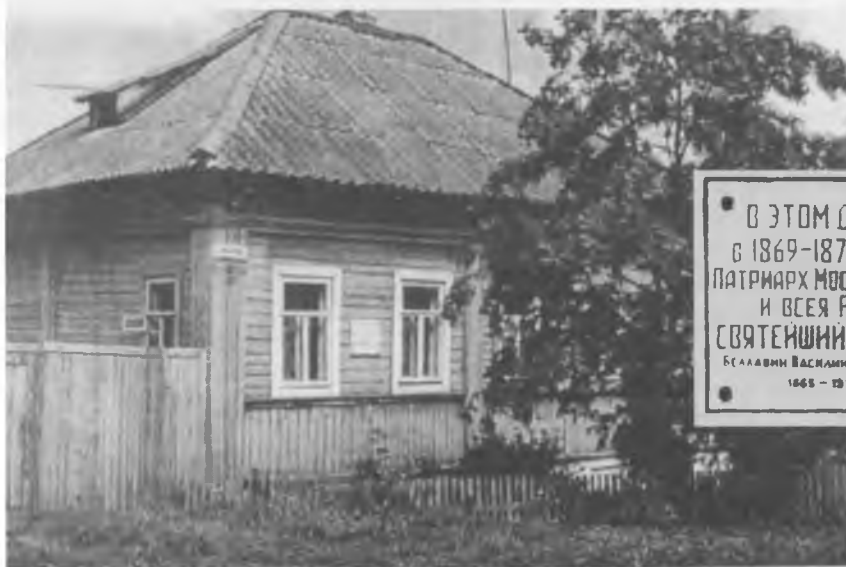
Дом Беллавиных по ул. Никитина, 8 (современный вид). В 1997 г. на доме установлена мемориальная доска