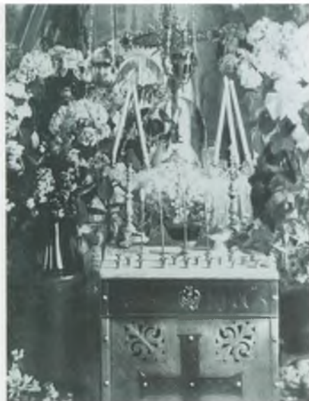
Место захоронения Патриарха Тихона в Малом соборе Донского монастыря. 1925 г.

Из кн.: Донской ставропигиальный мужской монастырь