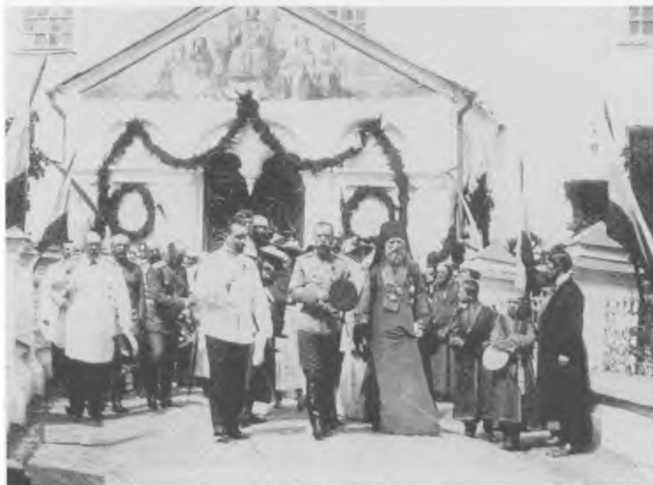
Государь император Николай II с архиепископом Ярославским и Ростовским Тихоном в дни празднования 300-летия Дома Романовых

Ростов, 1913 г.