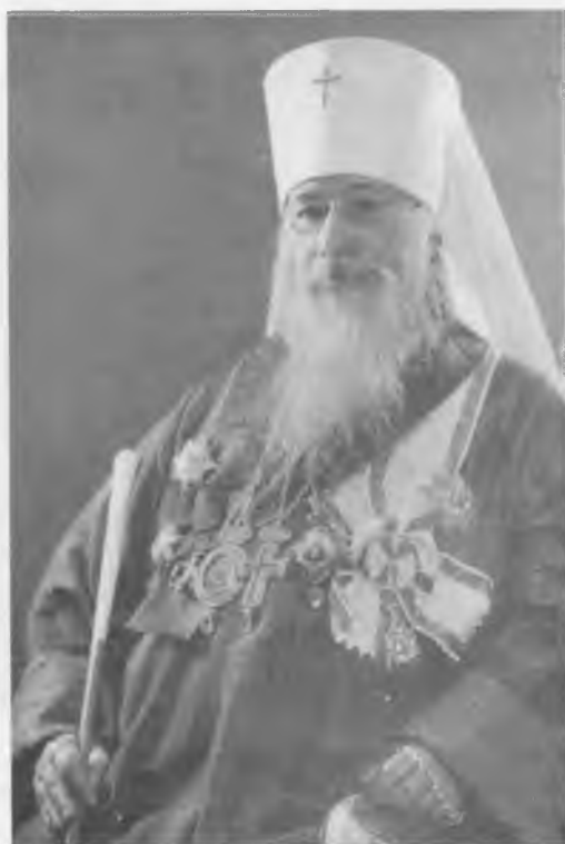
Управляющий русскими приходами в Западной Европе митрополит Евлогий (Георгиевский)

Снимок сделан 25.01.1938 г., в день тридцатилетнего юбилея епископского служения. Париж