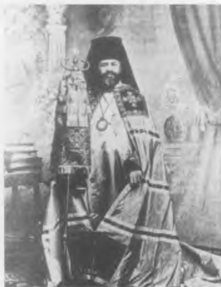
Святитель Рафаил (Ававини), епископ Бруклинский (святой Православной Церкви в Америке)