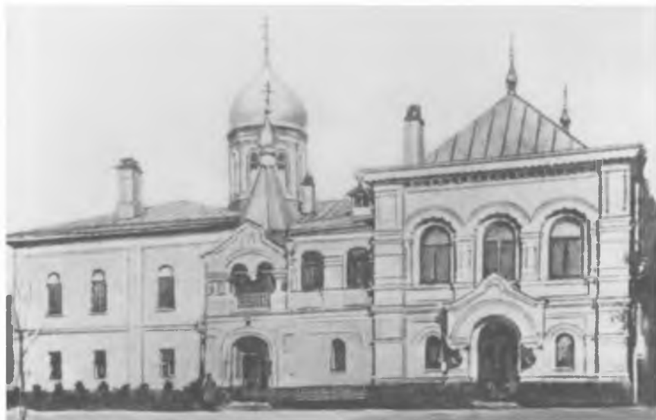
Митрополичьи палаты Троицкого подворья в Москве Резиденция Патриарха Тихона в 1917—1922 гг. Фотография конца XIX века