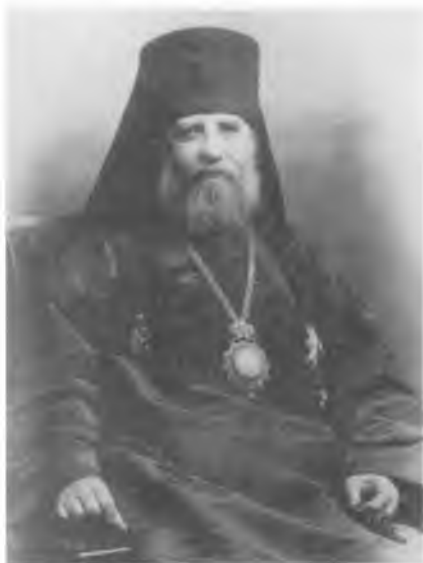
Архиепископ Виленский и Литовский Тихон. 1915 г.