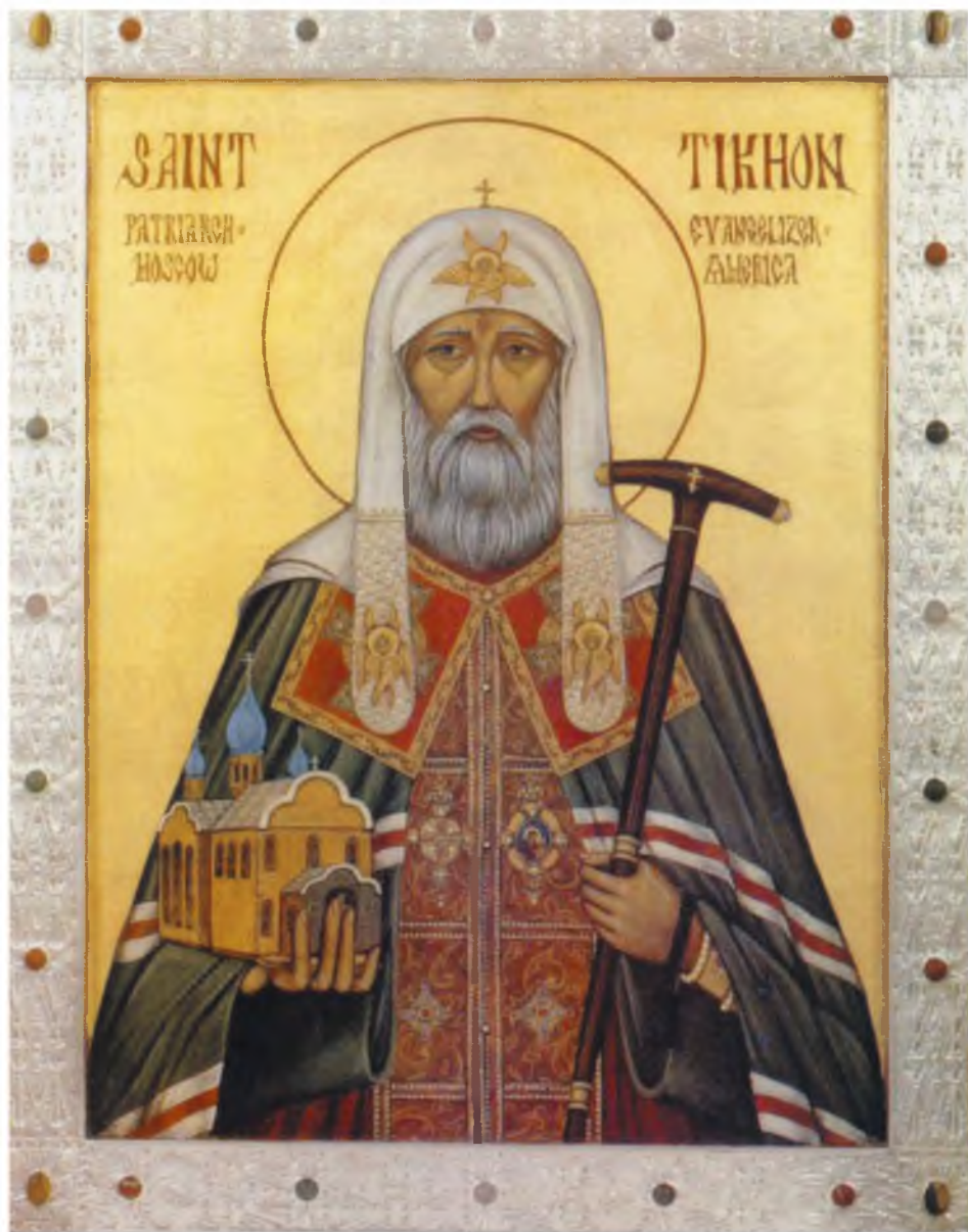
Святитель Тихон, Патриарх Московский, Просвятитель Америки. Икона, написанная в Америке в 1980-е годы