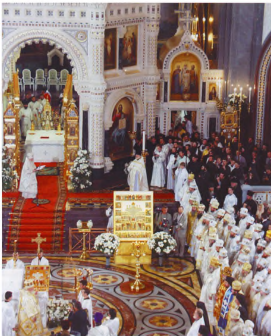
Прославление новомучеников и исповедников Российских Храм Христа Спасителя 20 августа 2000 года