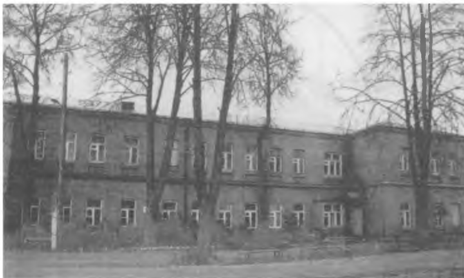
Современный вид здания бывшего Торопецкого духовного училища, в котором учился Василий Беллавин (ныне больница)