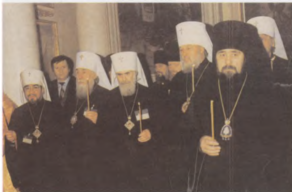
Участники Архиерейского Собора во время чина канонизации