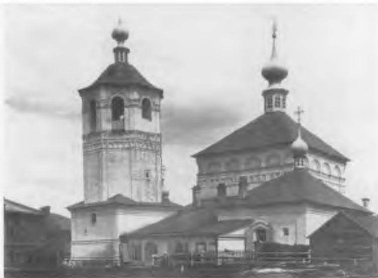
Спасо-Преображенская церковь в г. Торопце, настоятелем которой был священник Иоанн (Беллавин)