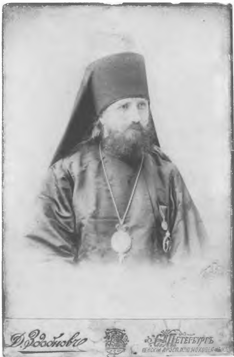
Епископ Люблинский Тихон Первая фотография после хиротонии. Октябрь 1897 г.