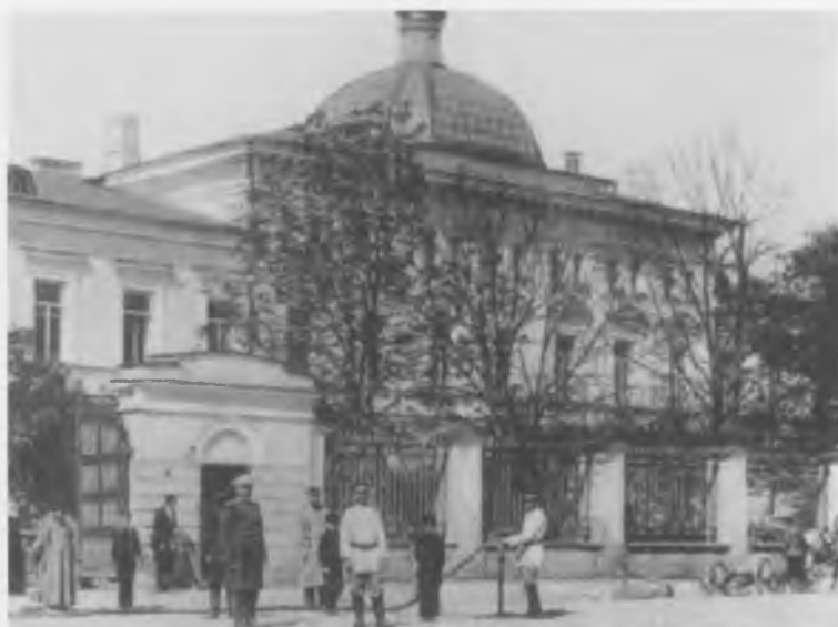
Здание Псковской духовной семинарии, где учился, преподавал и был пострижен в монашество Василий Беллавин