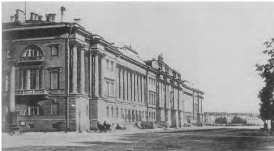
Здание Святейшего Правительствующего Синода в Санкт-Петербурге