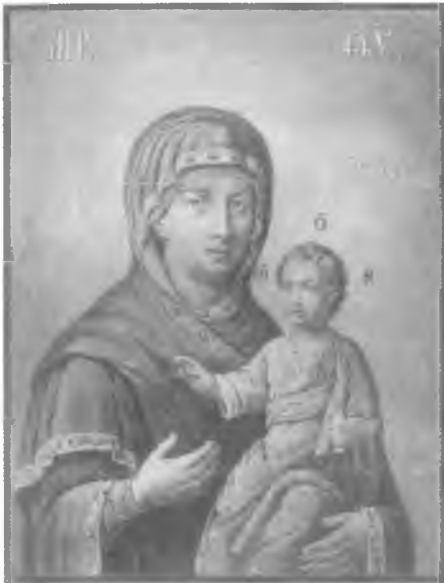
Главная святыня г. Торопца чудотворная икона Божией Матери Корсунская

Воскресенской церкви в селении Белавин, (Белавинский храм); по ополчению 42. Благословенная икона Божией Матери Корсунская. В С. Петербурге в 1815 году от Антипатрия Угрюмова куплена; в 1847 году в селении Торопца куплена у г. Навашина Архимандрита Никодима в Корсунском про- изведении в селении Торопца у г. Ларимова, в селении Торопца, в 1848 году в декабре в селении Торопца произведена перемещение в селение в селении Торопца в селении Торопца. Икона Божией Матери Корсунская в селении Торопца, в селении Торопца в селении Торопца в селении Торопца в селении Торопца в селении Торопца в селении Торопца в селении Торопца