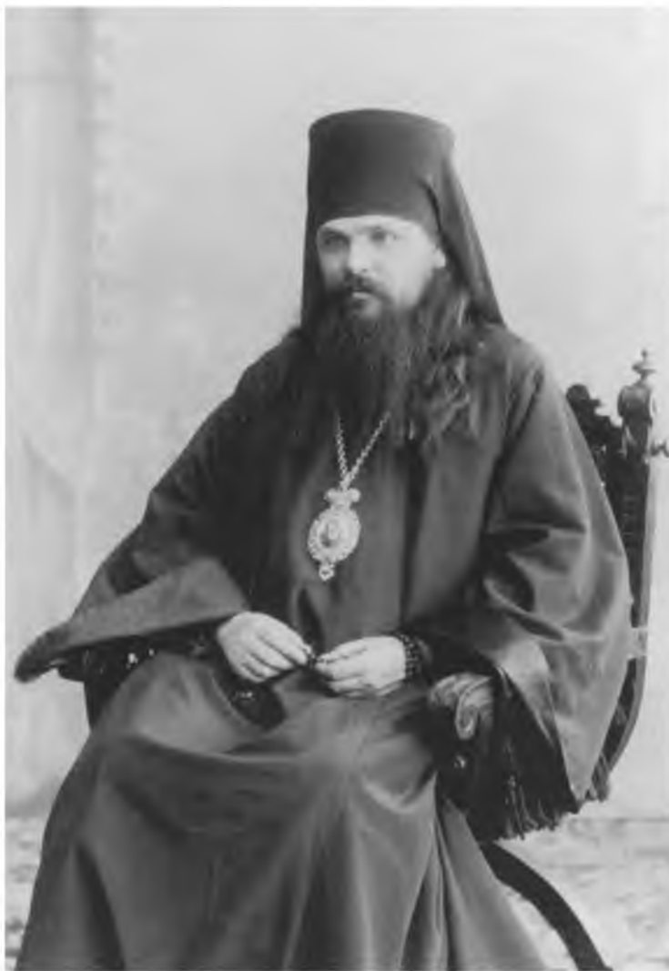
Священномученик архиепископ Астраханский Митрофан (Краснопольский)