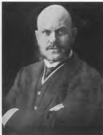
В. Н. Львов, обер-прокурор Святейшего Синода (28.02.1917—24.07.1917)