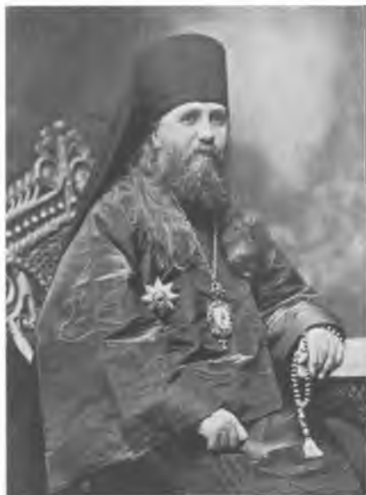
Архиепископ Ярославский и Ростовский Тихон ЦИА ПСТГУ