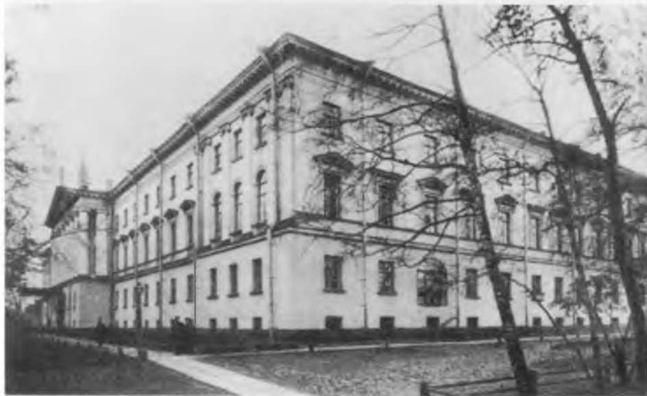
Санкт-Петербургская Духовная Академия