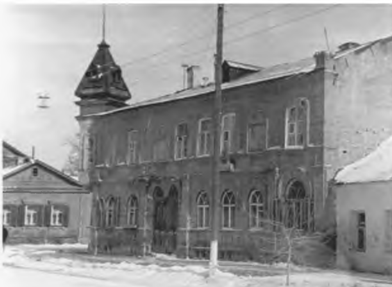
Дом, в котором проживал последние дни перед арестом архиепископ Астраханский Митрофан (Краснопольский). Астрахань, ул. 3-го Интернационала, № 2