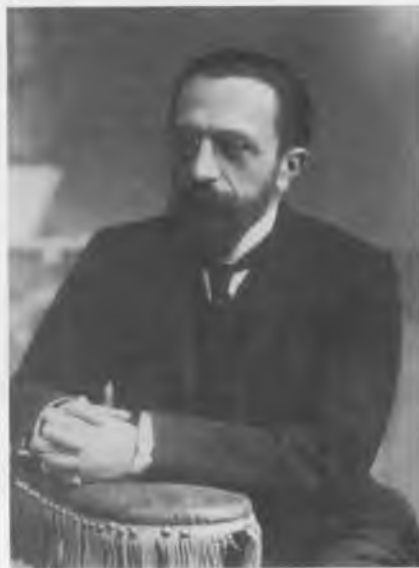
Князь А. А. Ширинский-Шихматов, обер-прокурор Святейшего Синода (26.4.1906—09.07.1906)