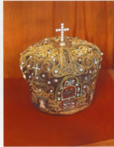
Митра Святителя Тихона

Из кн.: Донской ставропигиальный мужской монастырь