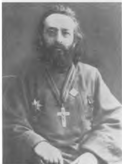
Протопресвитер Георгий Шавельский