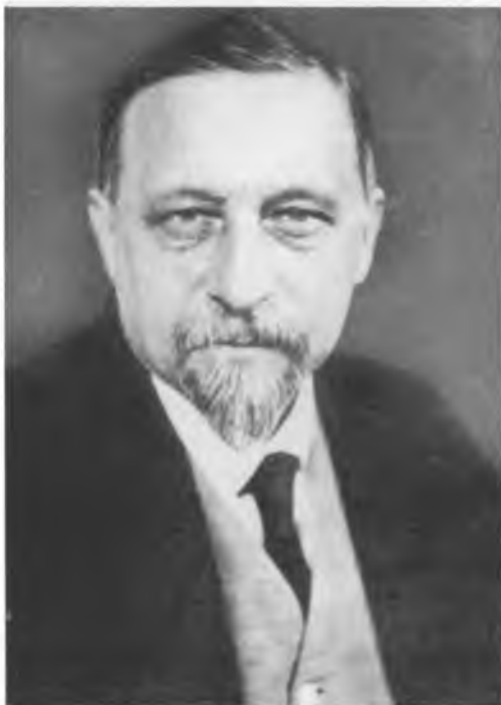
А. В. Карташев, последний обер-прокурор Святейшего Синода (24.07.1917—15.08.1917) и министр исповеданий Временного правительства