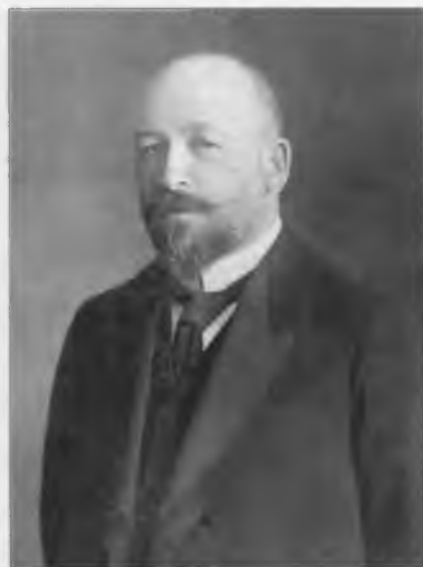
А. Д. Самарин, обер-прокурор Святейшего Синода (05.07.1915—26.09.1915)