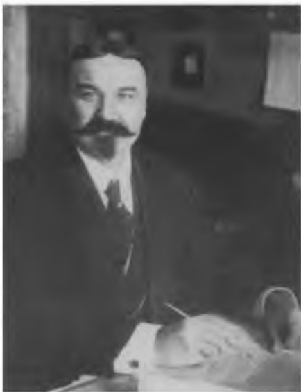
Н. П. Раев, обер-прокурор Святейшего Синода (30.08.1916—28.02.1917)