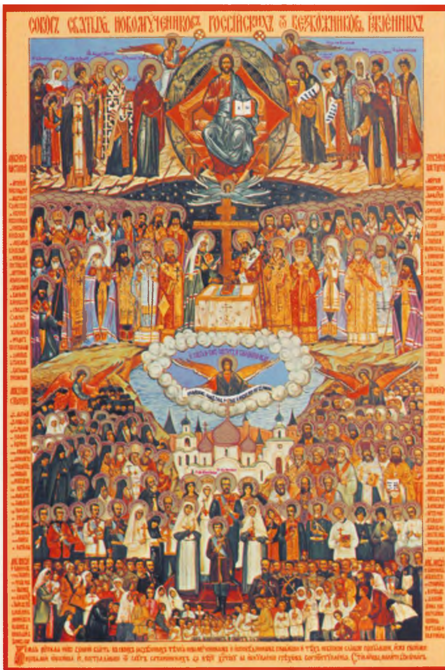
Собор святых новомучеников и исповедников Российских от безбожников убиенных. Икона 1981 г., написанная к прославлению новомучеников и исповедников Российских в Русской Православной Церкви Заграницей ЦИА ПСТГУ