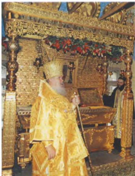
Место обретения мощей Святителя Тихона в Малом соборе Донского монастыря