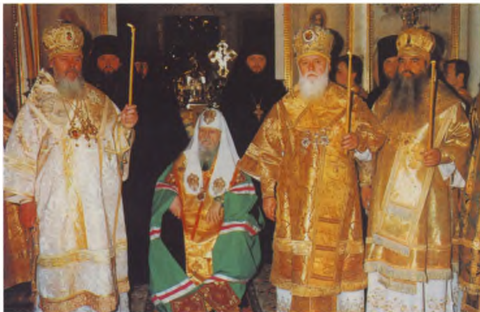
Чин канонизации совершают Святейший Патриарх Пимен и постоянные члены Священного Синода