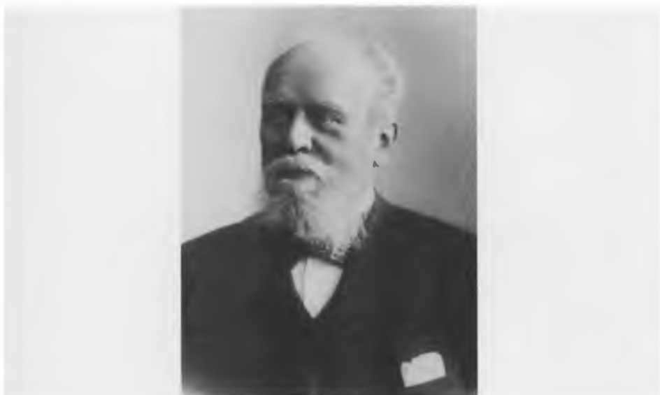
В. К. Саблер (Десятовский), обер-прокурор Святейшего Синода (02.05.1911—05.07.1913)