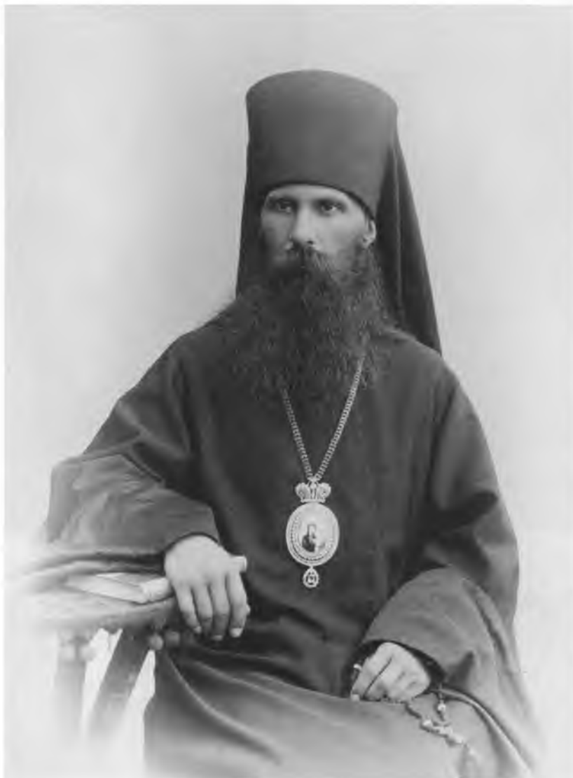
Епископ Симферопольский и Таврический Михаил (Грибановский)