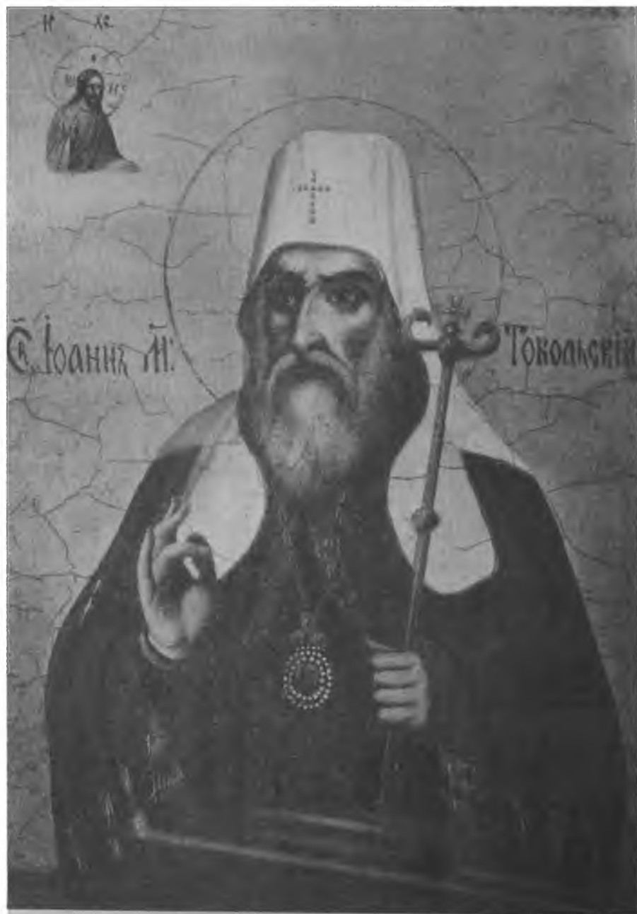
Святитель Иоанн Тобольский. Икона начала XX века