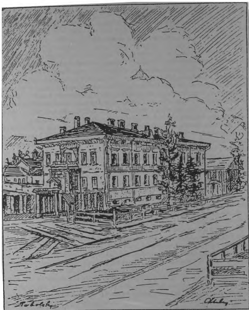
Губернаторский дом в Тобольске, в котором жили Царственные Узники