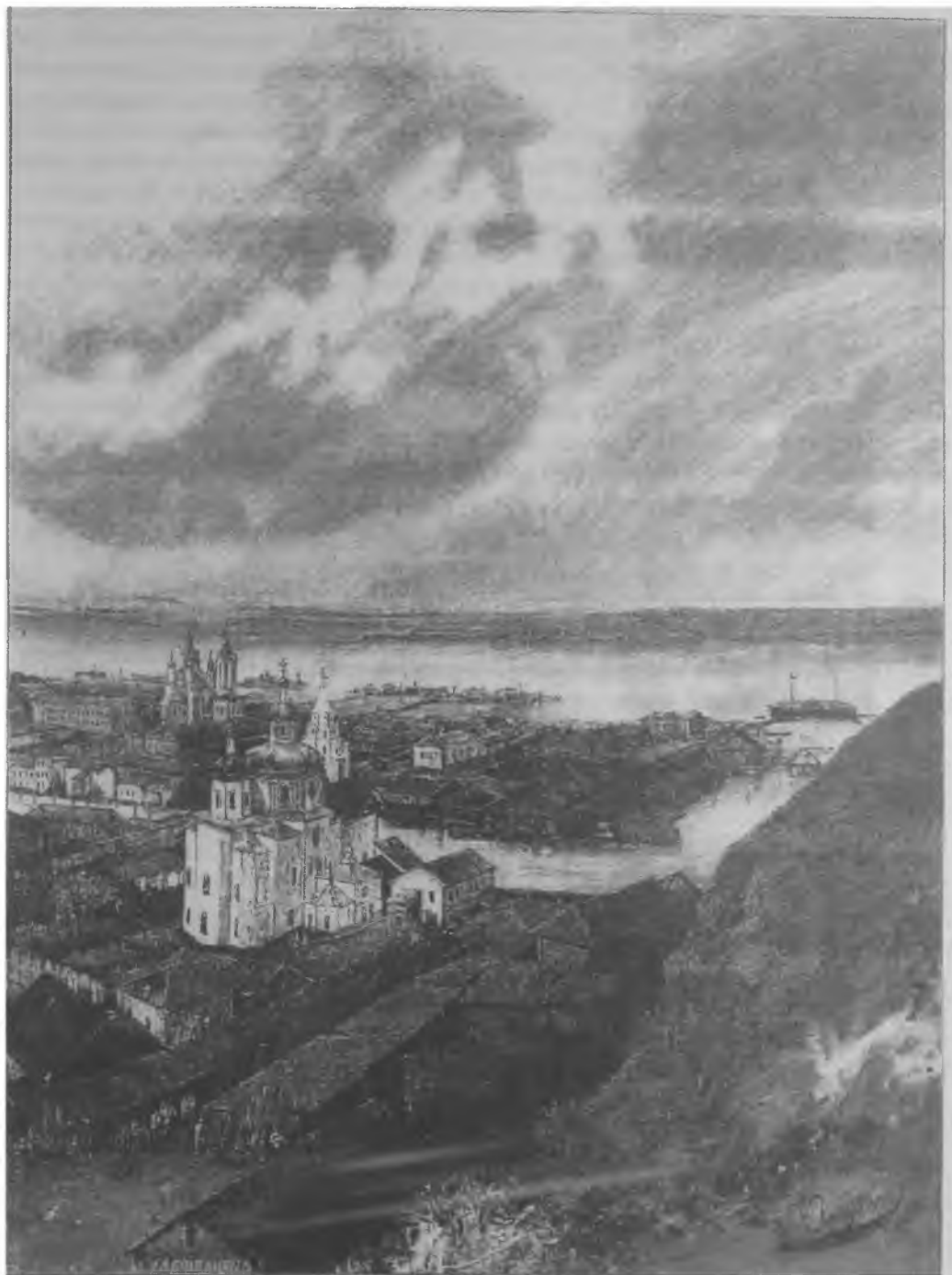
Общий вид г. Тобольска. Рисунок конца XIX века