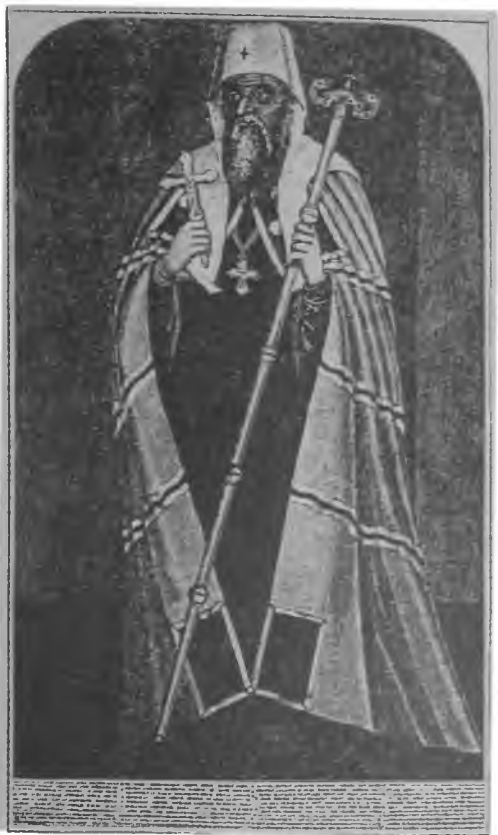
Архипастырь Тобольский. Изображение из собрания древностей кафедрального собора г. Тобольска.