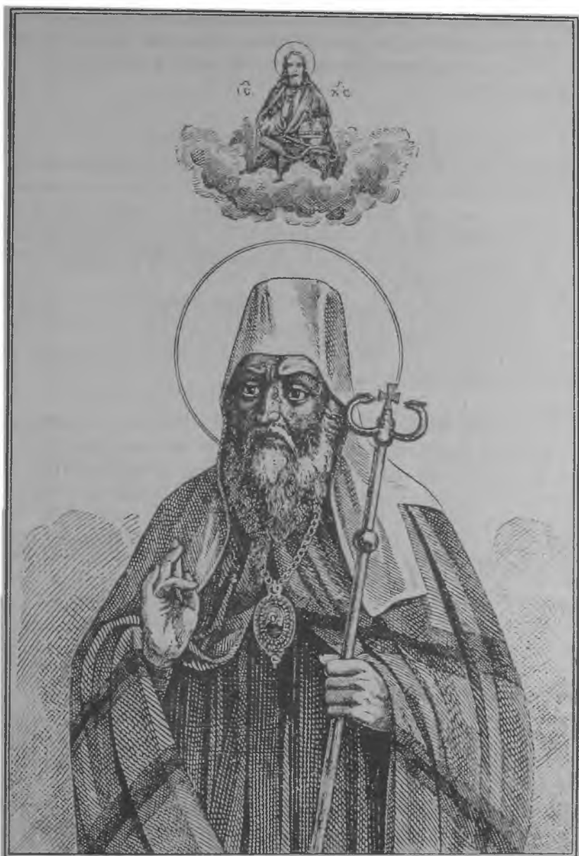
ЮАННЪ АЛЕКСАНДРОВИЧЪ, МЕТРОПОЛИТЪ ТОБОЛЬСКІЙ И ВСЕЯ СИБИРИ.

Приказали: Преосвященный Тобольский, представляя снимок с изображения святителя Тобольского Иоанна, наиболее точно, по его удостоверению, воспроизводящего черты земного образа угодника Божия и соответствующего историческим сведениям о жизни и деятельности Святителя, просит об утверждении этого изображения, как образца для писания икон Святителя. Обсудив сие ходатайство Преосвященного Тобольского и признавая его заслуживающим удовлетворения, Святейший Синод определяет: означенное изображение святителя Иоанна одобрить в качестве образца для писания икон с теми изменениями, какие сделаны в нем на прилагаемом при сем снимке сего изображения, и с предоставлением делать на иконах не только поясное изображение Святителя, но и писать его во весь рост 598 .