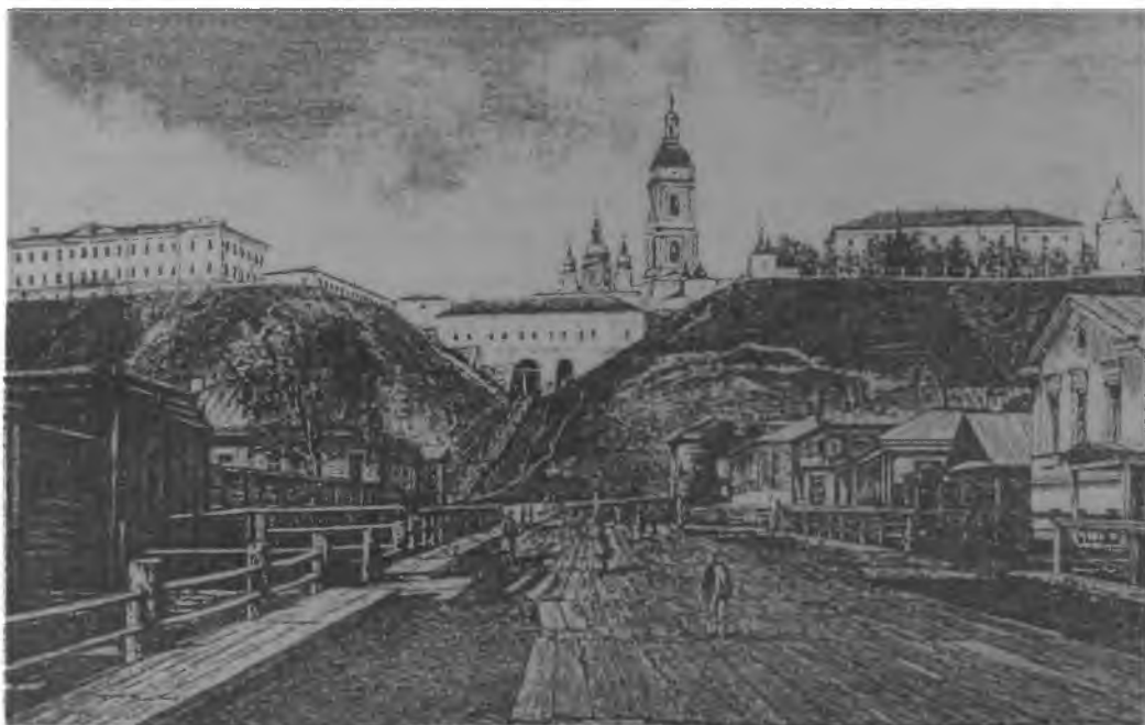
Деревянная мостовая в г. Тобольске