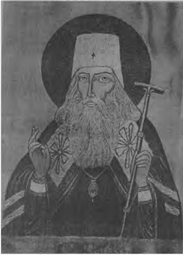
Святитель Иоанн Тобольский. Шитая икона начала XX века