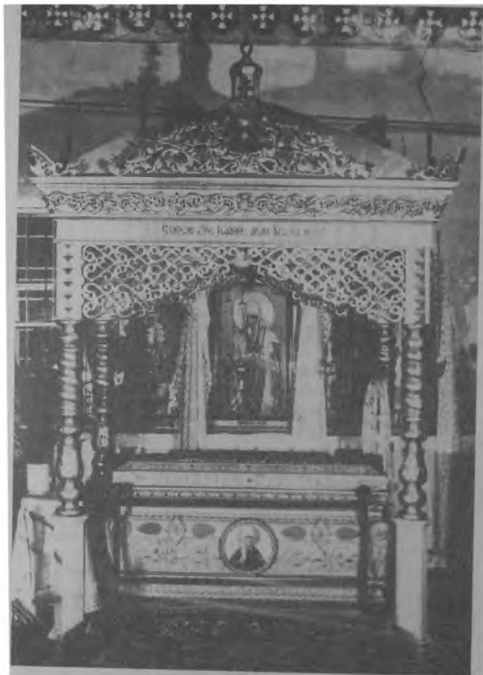
Сень над ракой с мощами святителя Иоанна Тобольского. Современное фото