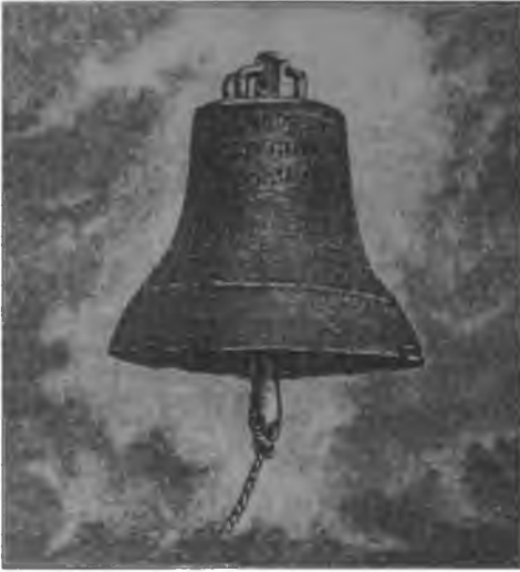
Ссылный колокол из Углича. Тобольский губернский музей.