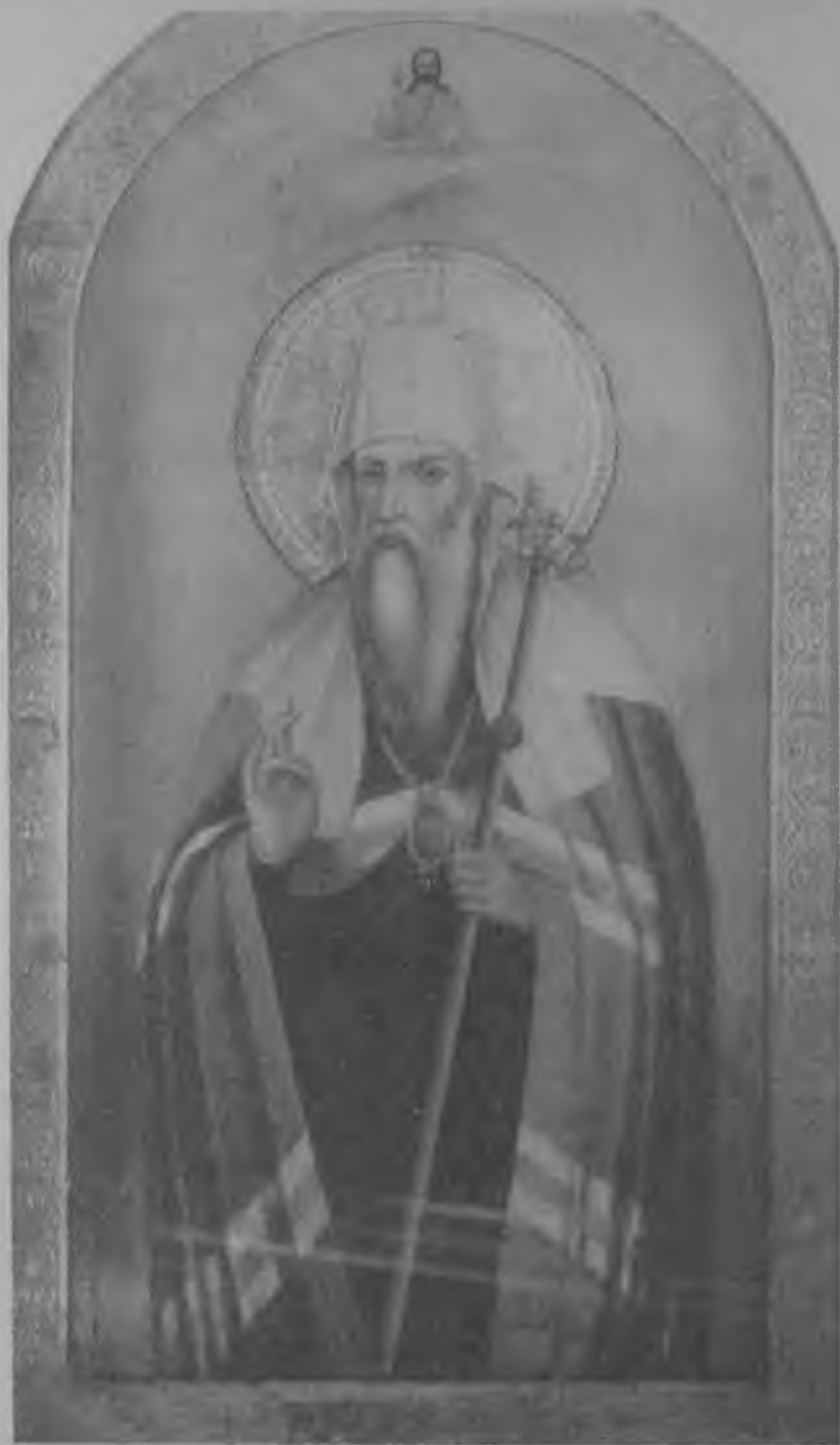
Святитель Иоани, митрополит Тобольский. Икона в Покровском соборе г. Тобольска. Начало XX века