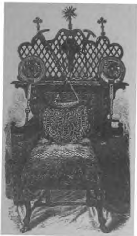
Старинное архипастырское седалище, хранившееся в Тобольской ризнице.

К сожалению, о многих сторонах деятельности Святителя в Сибири мы не знаем почти ничего. Дело в том, что весь архив Тобольской Духовной консистории погиб во время пожара ** . Исследователям удалось обнаружить единственный письменный памятник, связанный со Святителем, – грамоту, написанную