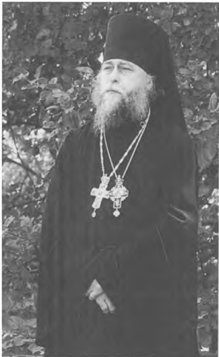
Архимандрит Макарий (Веретенников)