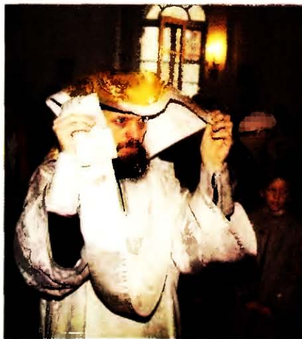
Рукоположение во пресвитера. Ставленник на великом входе несет воздѹх

Из творений свт. Иоанна Златоуста († 407) можно заключить, что в нач. V в. только архиерей мог восседать на горнем месте в отличие от пресвитеров, садившихся по сторонам от него ( Paverd F. van de . P. 417–428). Это отличие до сих пор сохра-