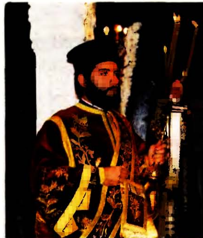
Греческое архиерейское богослужение. Архидиакон с трикирием

он награжден ею), митру ; как архипастырь архиерей имеет архипастырский жезл (в рус. традиции украшается сулком ; в поздней греч. практике сулком украшают свои жезлы председатели Поместных Церквей; в РПЦ Патриарх, как правило, служит с особым жезлом без сулка); как монах архиерей облачается также в монашеские одежды, из них богослужбное значение имеют архиерейская мантия , клобук или куколь , у Патриарха — второй параман ( Дмитриевский . Ставленник. С. 265–329). В греч. практике дикирий и три-