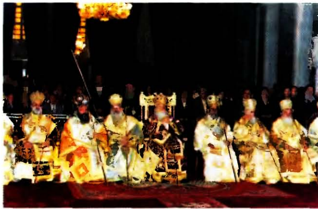
Служение греческих иерархов. Начало литургии

(Благословѣнїе гдѣ...) архиерей благословляет народ на престольным крестом (согласно Архиератикону — рукой); 27) после отпуста, во