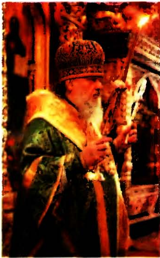
Во время Трисвятого. Служение Патриарха Московского и всея Руси Пимена

великого входов и времени Причащения, у царских врат стоят посошник с архиерейским жезлом и (если службу совершает правящий архиерей) иподиакон с примикирнем; 11) во время энарксиса епископ сидит на кафедре, специально поставляемой на архиерейском амвоне, встанет для чтения молитв антифонов; 12) малый вход начинается с целования иерархом Евангелия и осенения народа на 4 стороны трикирием и дикирием и пения духовенством в 1-й раз: «Прїидїте, поклонїмсѧ...»; затем архиерей поднимается на солею, осеняет лики на 2 стороны трикирием и дикирием, «Прїидїте, поклонїмсѧ...» поет хор во 2-й раз; при пении духовенством «Прїидїте, поклонїмсѧ...» в 3-й раз епископ, держа в левой руке дикирий (Патриарх держит вместо дикирия жезл), кадит алтарь, перед епископом предходит протодиакон с трикирием; во время каждения соли, иконостаса, хора и народа и в алтаре, и певцами поочередно поется «Εἰς πολλὰ ἔτη, δέσποτα»; 13) при Патриаршей службе перед последним кондаком после пения стиха «Гдї, спасїи благочестїивыѧ...» возглашается т. н. великая похвала (помяновение Глав 15 автокефальных Церквей, властей и всех православных); малая похвала (прогносившаяся до иконовских реформ и донныне существующая в греч. практике), предназначенная для обычного (не Патриаршего) А. б., в совр. рус. практике, как правило, опускается; 14) пение последнего кондака в алтаре; 15) Трисвятое поется не 4 с половиной, а 7 с половиной раз