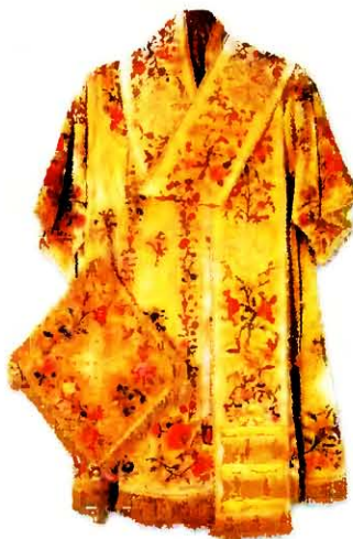
Саккос, большой омофор и паница. XIX в. (ЦАК МДА). Принадлежали Патриарху Московскому и всея Руси Сергию

чающиеся от одежд проч. клириков, содержится в «Апостольских постановлениях» (VIII 12. 4). В вост. традиции главным знаком отличия епископа от пресвитеров служит омофор , упоминаемый как обычное архиерейское облачение уже при Исидором Пелусиотом († 1-я пол. V в.) ( Κοῦρκοῦλα . Σ. 63–65). Вплоть до XI–XII вв. омофор был единственным знаком отличия архиереев и надевался поверх полного священнического облачения, но со временем к архиерейским облачениям добавились и др., так что с XVIII в. полный комплект архиерейских облачений в правосл. традиции включает архиерейский камисий (т. н. подсаккосник), епитрахиль , пояс , поручи , паницу , саккос (может заменяться фелонью ), 2 омофора (большой и малый, из конх 1-й надевается во время процессии, 2-й — во время собственно тайнодействий), панагию (архиерей за богослужением также носит крест и вторую панагию, если