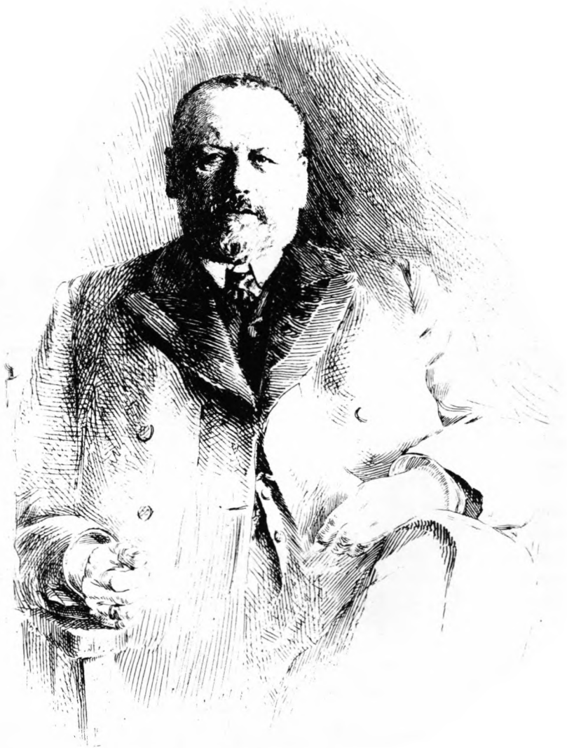
Михаил Владимирович Родзянко (гравюра)