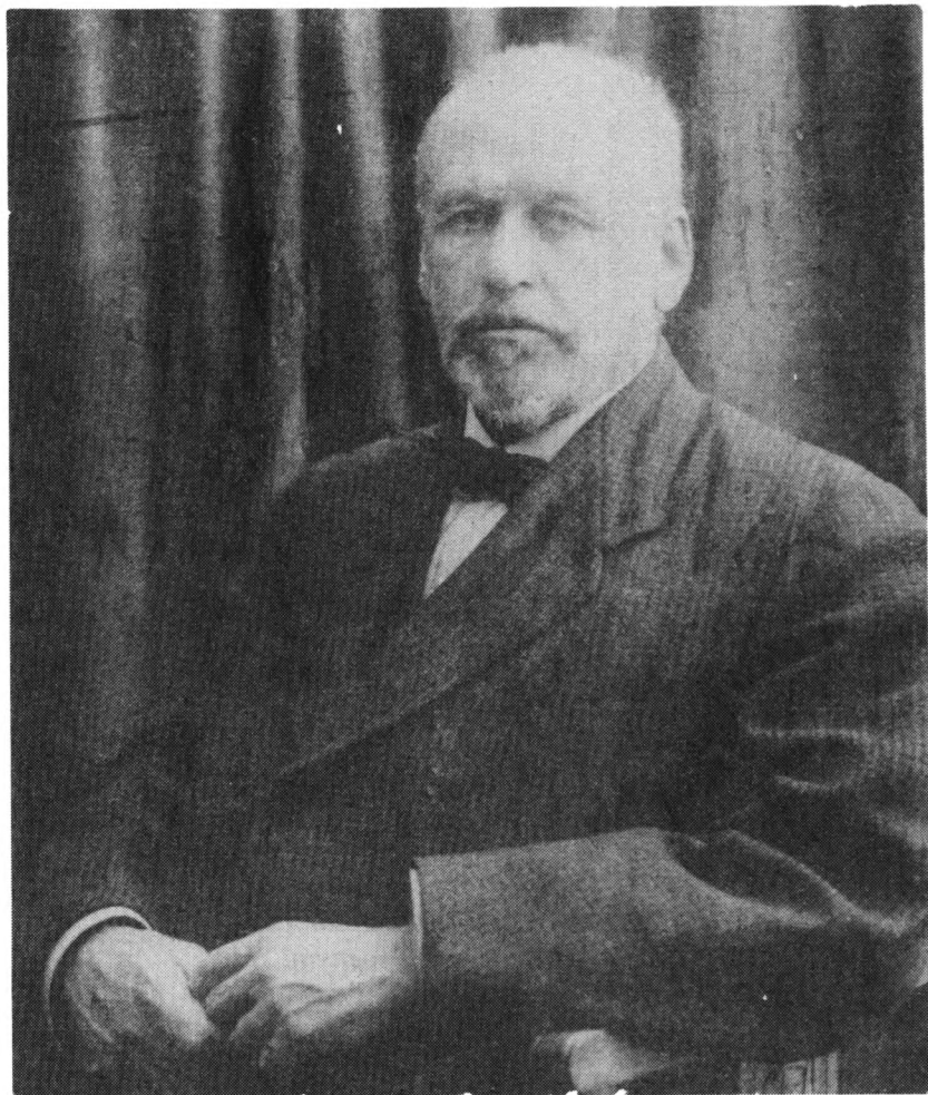
Михаил Владимирович Родзянко в Ростове н./Д. во время Белого Движения.