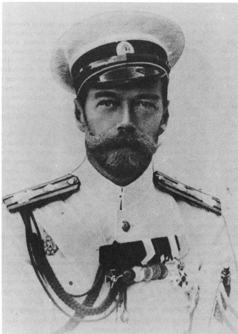
Копия той фотографии Государя Императора Николая II, которая постоянно стояла на письменном столе М.В. Родзянко до самой его смерти. После смерти М.В. стояла на столе его сына Михаила Михайловича.