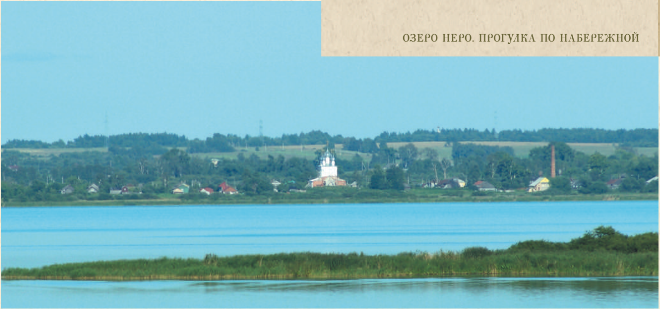
Достопримечательности других берегов

из-за постройки плотины сильно заросла, так, что плыть по ней даже на обычной лодке затруднительно.