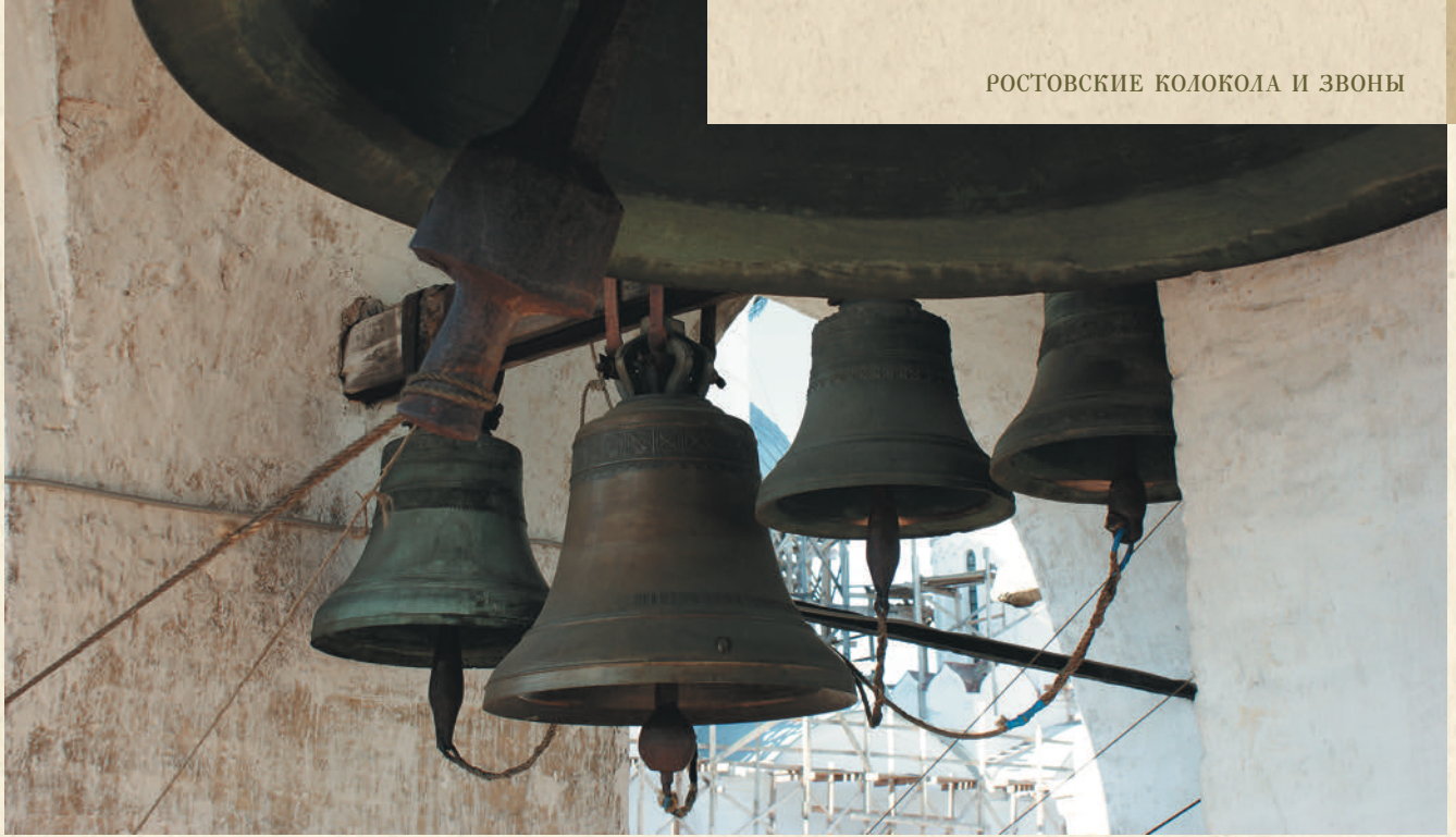
Малые колокола соборной звонницы

колокола древнего происхождения расположены между третьим и четвертым пролетами. Из четырех колоколов, повешенных в четвертом пролете звонницы сразу же по окончании ее строительства, сохранились только три: «Баран» и два зазвонных. «Баран» (80 пудов) создан в 1654 году московским мастером Емельяном Даниловым. Висящий здесь же колокол «Голодарь» (171 пуд) изготовлен в 1856 году на заводе Ярославского купца Чарышникова. Когда-то на его месте висели «Голодарь» 1-й и «Голодарь» 2-й, которые были разбиты. Свое имя колокол получил от того, что в него благовестили во время Великого Поста.