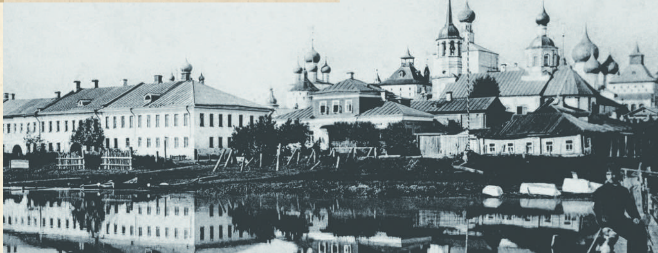
Подозерье. Открытка начала XX века