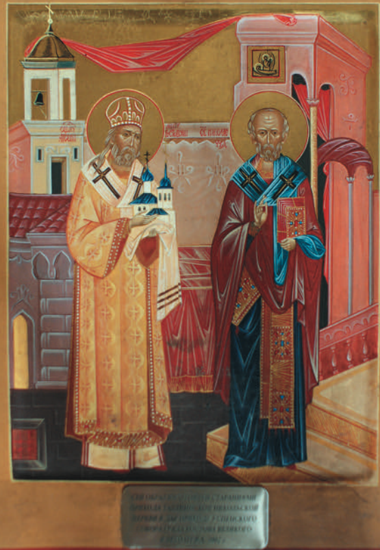
Икона священномученика Арсения Мацеевича и святителя Николая. Дар ростовцам от прихожан Никольского храма Таллина, в котором покоятся мощи свецмч. Арсения