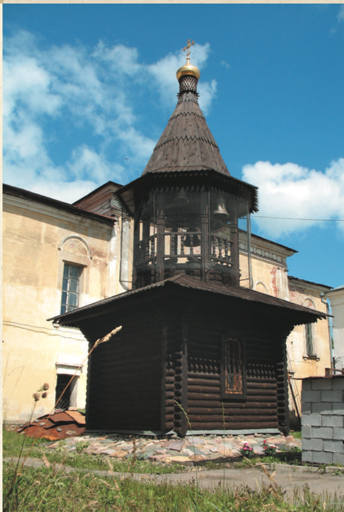
Звонница Рождественского монастыря