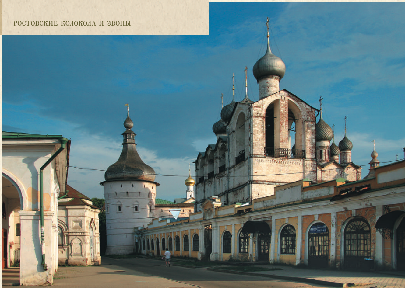
Звонница и торговые ряды

которые исполнялись двумя звонарями на малых и средних колоколах.