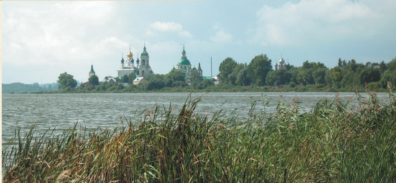
Вид на Спасо-Яковлевский монастырь из центра города

Они следуют к Спасо-Яковлевскому монастырю, огибают Рождественский остров и возвращаются к причалу. Все же,