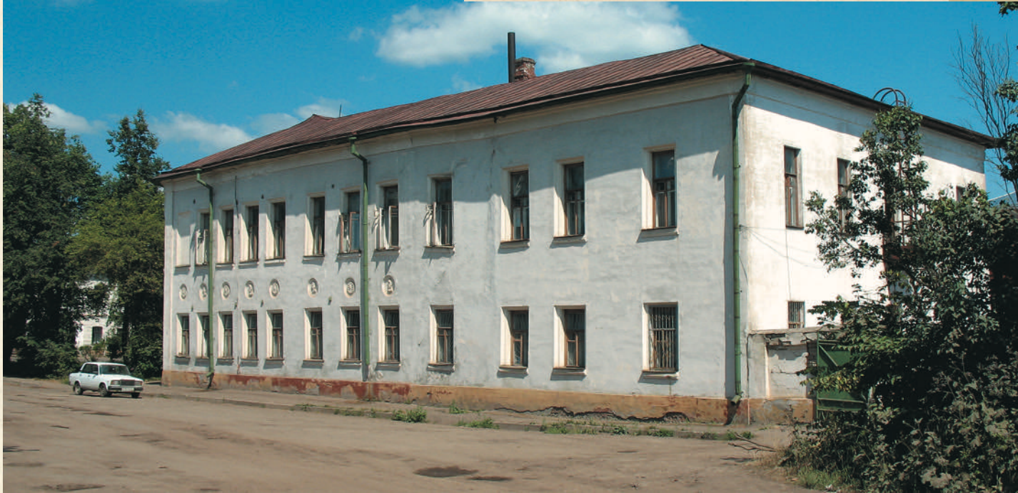
Здание на месте течения реки Пижермы, в которой крестились ростовцы. Рождественская (Советская) площадь, 2–8.