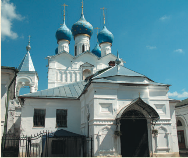
Храм Спаса на торгу

существенно искажен. Однако в 1960–1970-х годах, когда происходило восстановление построек Ростовского кремля, поврежденных смерчем, Спасской церкви также был возвращен ее первоначальный вид. Правда, просторную и удобную позднюю пристройку для теплых приделов оставили. В церковном интерьере сохранились характерный для Ростова фресковый иконостас и стенные росписи, датировка которых в настоящее время не определена. Часть исследователей относят их к 1690-м годам, некоторые считают их работой ярославских мастеров 1760-х годов.