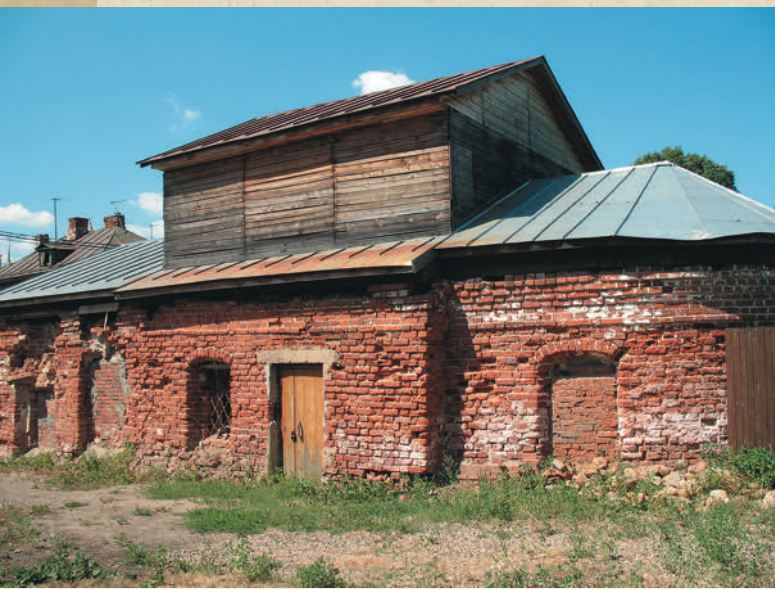
Храм святого Димитрия Ростовского. 1762

церкви относится к 1761 году. Спускаясь к озеру, вы и увидите то, что от него осталось. Слева находится обезображенный до неузнаваемости храм в честь святого Димитрия Ростовского, построенный в 1762 году.