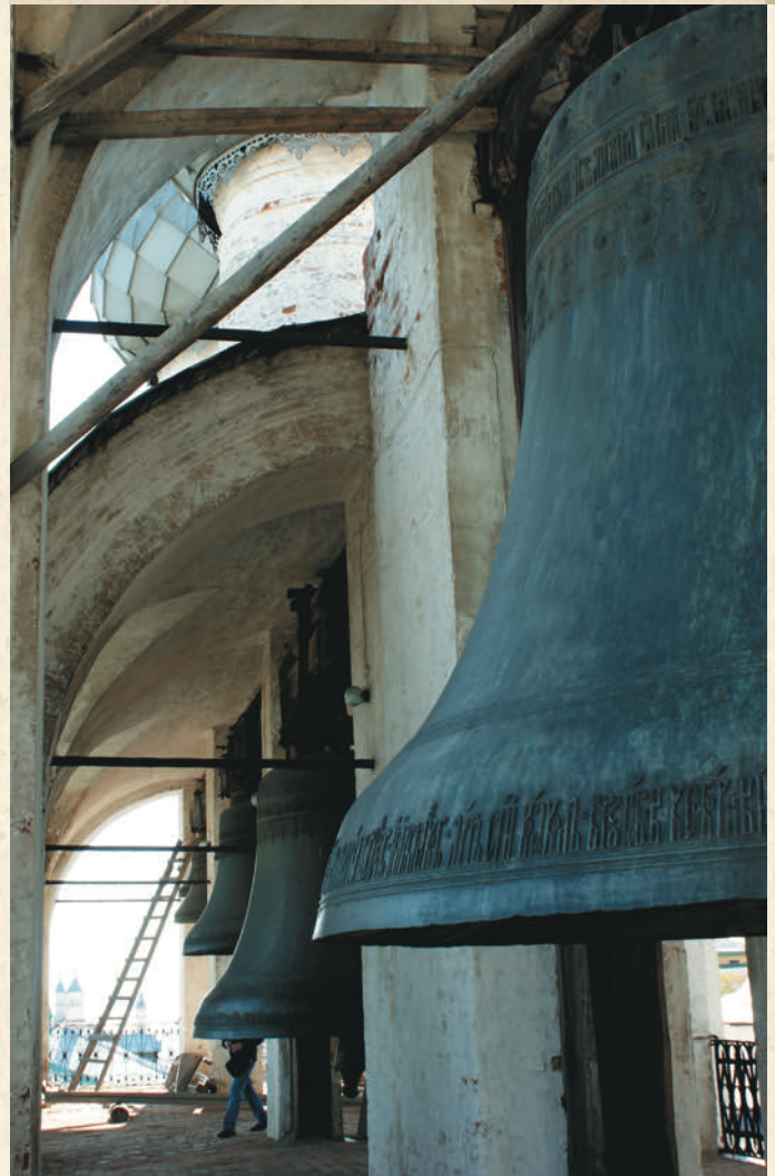
Большие колокола соборной звонницы