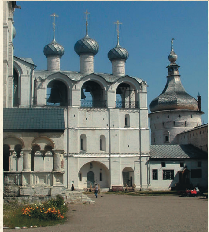
Соборная звонница с храмом Входа Господня в Иерусалим

Особую славу собору принесли колокольные звоны. Звонница и уникальный набор огромных старинных колоколов, самые тяжелые из которых весят 2 000, 1 000 и 500 пудов, появились во второй половине XVII века. Это также результат творческой энергии митрополита Ионы Сысоевича. Торжественные и величественные ростовские звоны переносят