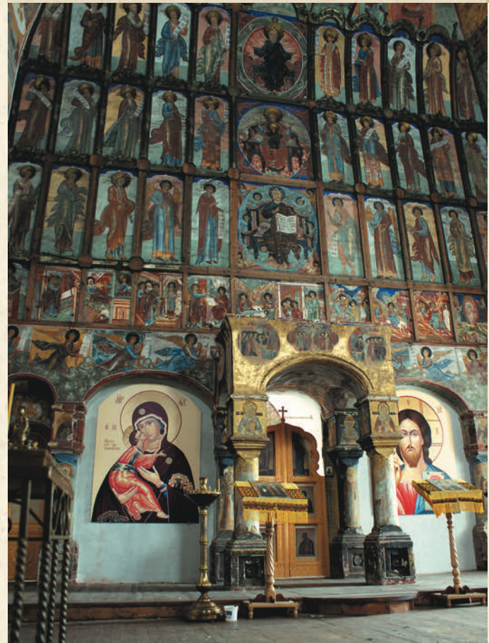
Интерьер церкви Спаса на торгу

Примечательно, что у храма есть еще одно наименование — Спас-Ружный. Оно выделяет его среди прочих городских церквей, указывая на особый статус. Руга — это содержание приходского клира в Византии и Древней Руси, которое выдавалось деньгами или продуктами. Слово это греческое, его можно перевести как «житница» или «плата». От обычного жалованья руга отличалась тем, что изменялась в зависимости от ценности съестных припасов. Такой способ содер-