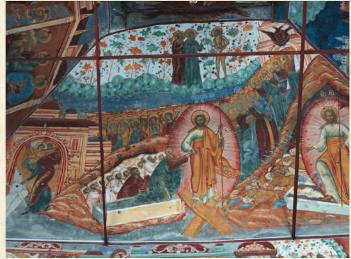
«Сошествие во ад». Роспись храма Спаса на торгу

И по внешним формам, и по своему внутреннему убранству церковь Спаса на торгу близка храмам Ростовского архиерейского дома. Располагаясь рядом с ним, она прекрасно вписывается в ансамбль, практически составляя с ним единое целое. Снежно-белый цвет ее стен и ярко-синие купола, украшенные золочеными звездами, привлекают к себе неизменное внимание.