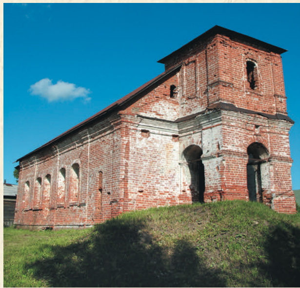
Борисоглебская церковь. 1761

Удивительное открытие было сделано в период 1986–1991 годов во время работы Архитектурно-археологической экспедиции Государственного Эрмитажа. Было обнаружено, что под Борисоглебской церковью XVIII века сохранился до сводов храм