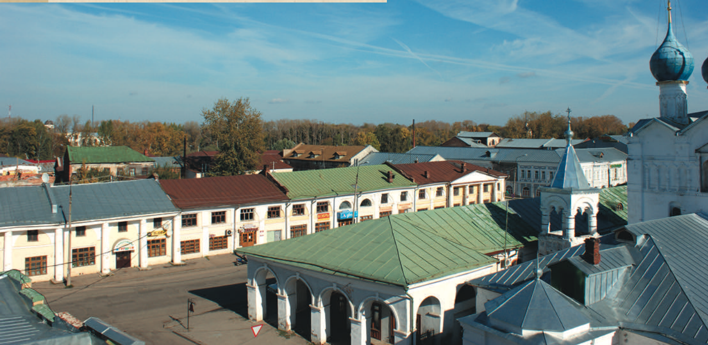
Вид на центр города с соборной звонницы

Спасский храм возвышается над рядами Гостиного двора , построенного в 1841 году петербургским архитектором Авраамом Ивановичем Мельниковым на месте существовавших здесь торговых рядов. Имя одного из самых видных архитекторов России первой трети XIX века выделяет ничем особо не примечательное для своего типа здание из ряда других построек, расположенных в центре Ростова.