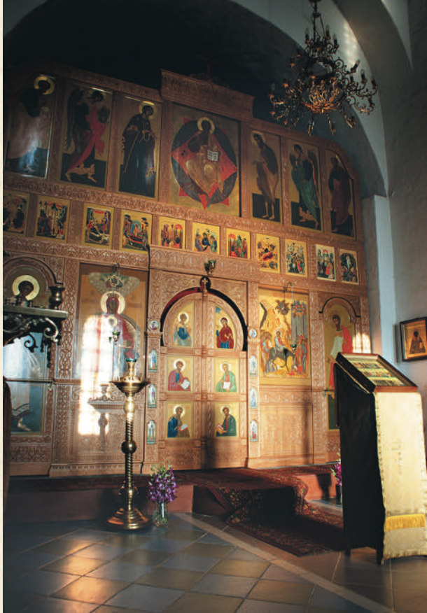
Интерьер храма Входа Господня в Иерусалим

святитель Тихон, патриарх Московский и всея Руси. В 1913 году здесь принимали императора Николая II со всей семьей. Даже после перевода архиерейской кафедры в Ярославль (1786–1788) и до настоящего времени собор сохранил за собой значение главного городского храма.