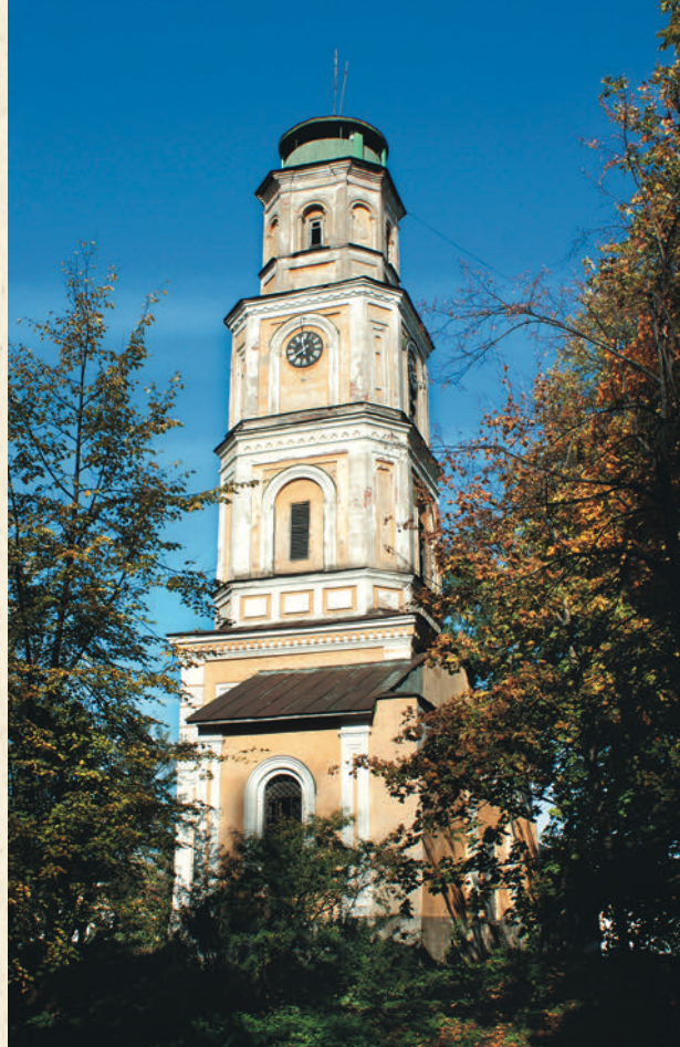
Колокольня Крестовоздвиженского храма

С восточной стороны границу Воздвиженской площади обозначает Окружная улица. На ней сохранилось множество зданий, интересных в архитектурном отношении. В основном это деревянные и каменные жилые дома XIX — начала XX века. Ярким примером сказанному может служить каменный особняк купцов Селивановых, находящийся по направлению к озеру (№ 5). Он построен в конце XVIII века, перестроен в начале XX столетия в стиле модерн архитектором Павлом Трубниковым. В настоящее время отреставрирован и в нем располагается гостиница.