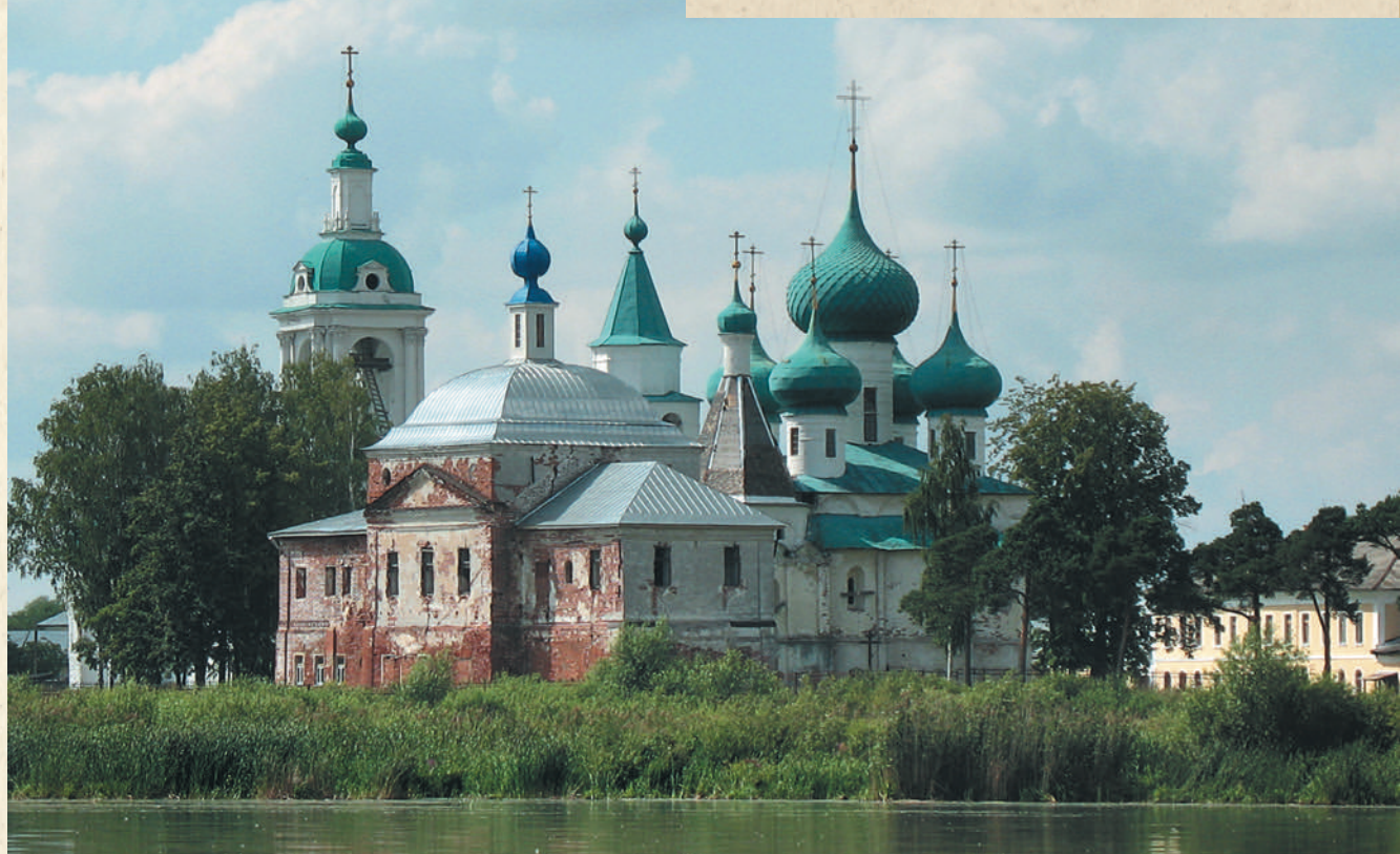
Вид Богоявленского Авраамиева монастыря со стороны озера Неро. На переднем плане — Введенский храм