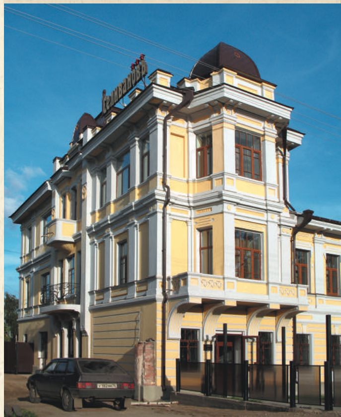
Дом Селивановых. Окружная улица, 5

С восточной стороны границу Воздвиженской площади обозначает Окружная улица. На ней сохранилось множество зданий, интересных в архитектурном отношении. В основном это деревянные и каменные жилые дома XIX — начала XX века. Ярким примером сказанному может служить каменный особняк купцов Селивановых, находящийся по направлению к озеру (№ 5). Он построен в конце XVIII века, перестроен в начале XX столетия в стиле модерн архитектором Павлом Трубниковым. В настоящее время отреставрирован и в нем располагается гостиница.