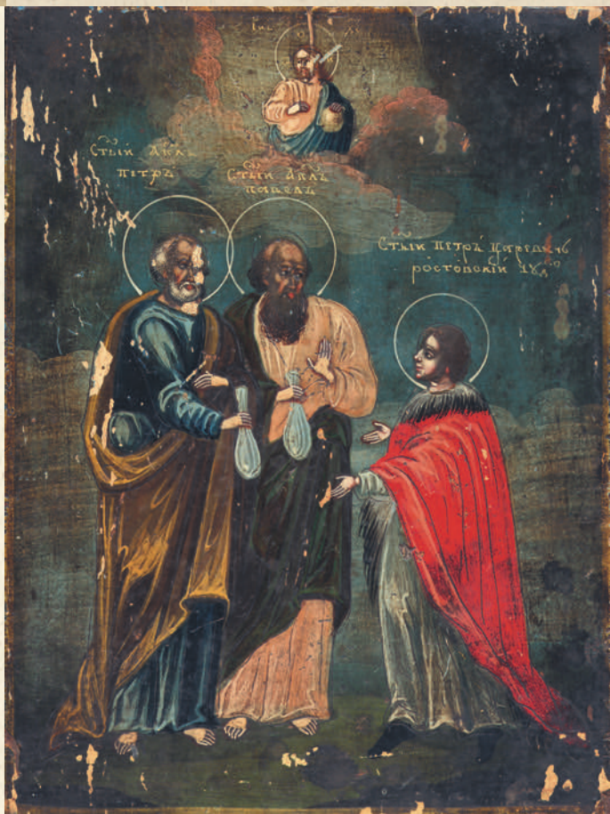
Икона «Явление апостолов Петра и Павла преподобному Петру, царевичу Ордынскому»