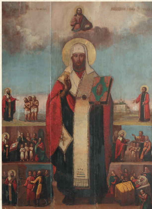
Икона святителя Леонтия Ростовского с житием

3 июня — святых равноапостольных Константина и Елены. 14 июля — святых целителей и бессребренников Космы и Дамиана Римских. 10 августа — иконы Пресвятой Богородицы Одигитрии.