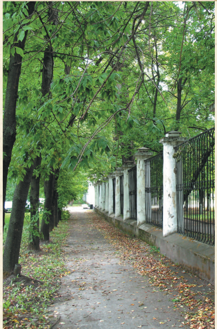
Ограда Городского парка. 1836

В парке есть архитектурные памятники. Это каменная беседка, построенная в начале XX века архитектором Н. Ю. Лермонтовым, дальним родствен-