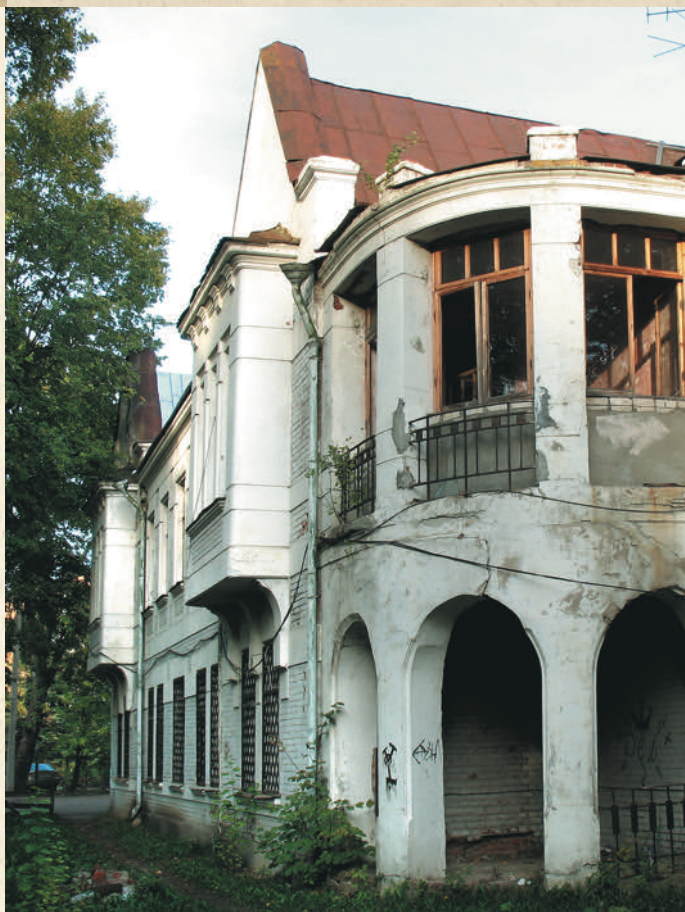
Здание администрации фабрики «Рольма»

Снова выходим на Ярославскую улицу. В оставшемся квартале историческая застройка почти не сохранилась, но и здесь есть здания, на которые стоит обратить внимание. Например, дом №78 — бывшая контора мельника, построенная в самом начале XX века. Сама мельница находилась в глубине двора на берегу озера.