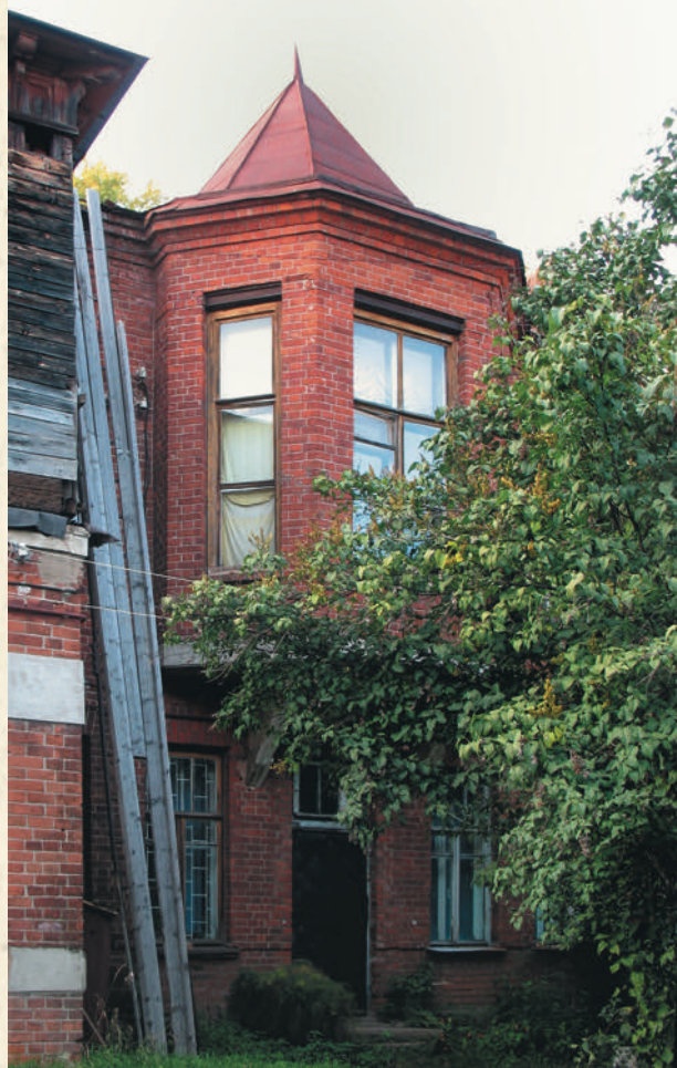
Внутренний двор здания администрации фабрики «Рольма»