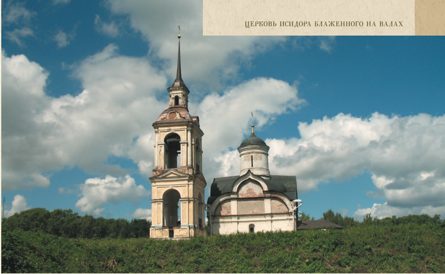
Вознесенский храм над гробом блаженного Исидора Твердислова