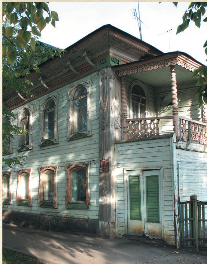
Дом Селивановых. Ярославская улица, 14