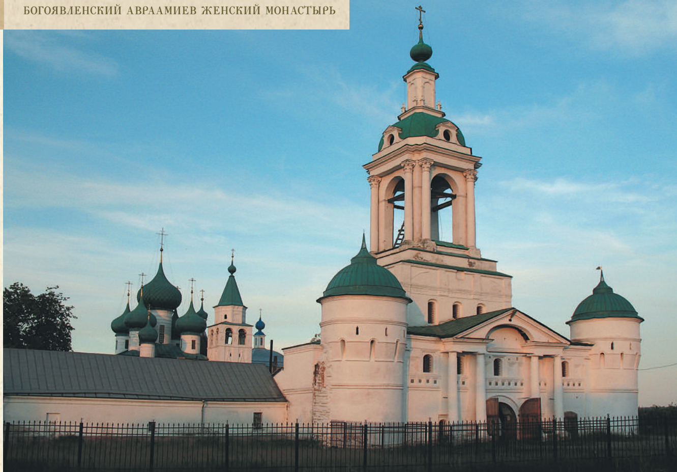
Святые врата обители и надвратный Никольский храм

Таким образом, древний облик всех монастырских церквей был значительно искажен в результате многочисленных перестроек, а также поругания святого места в советское время.