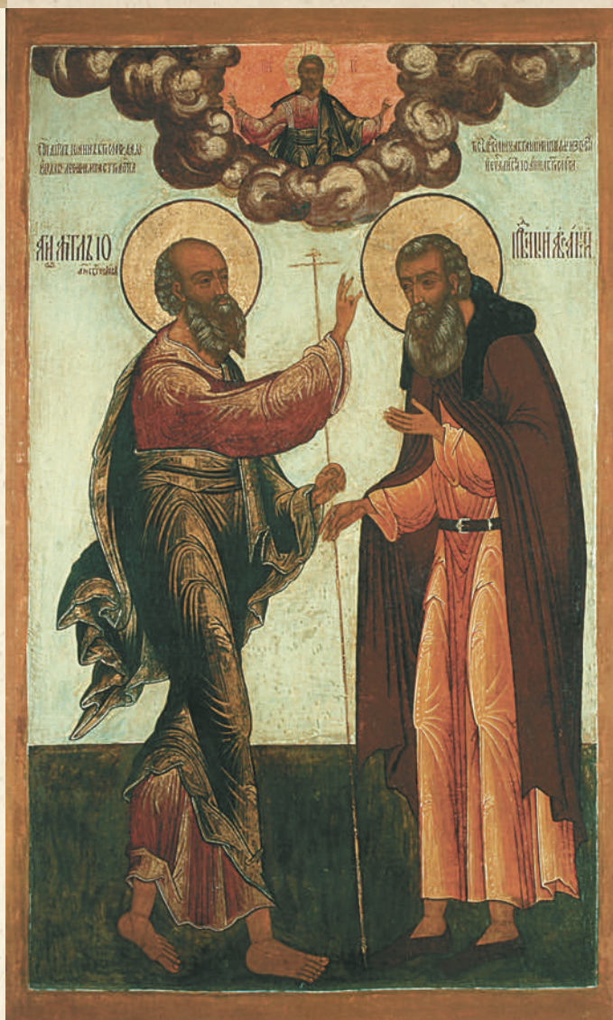
Икона «Явление апостола Иоанна Богослова преподобному Авраамиию Ростовскому». Конец XVII века

ла сокрушить идола, — отвечал Авраамий, — но молитва моя не выполняется”. “Если хочешь, — сказал старец, — чтобы исполнилось твое желание, иди