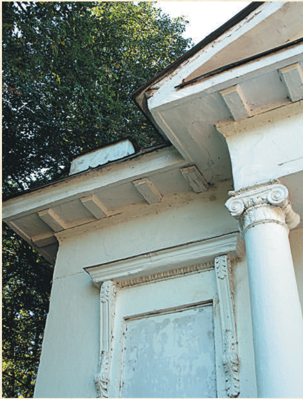
Фрагмент декора беседки в Городском парке

Когда-то здесь все было засажено деревьями и утопало в цветах, вечерами играл духовой оркестр. Сейчас парк выглядит более чем скромно, однако в будние дни, когда народу тут немного, приятно побродить по дорожкам, со смотровой площадки понаблюдать за озером, постоять на романтическом мостике, перекинутом через пересохшее русло реки Пиги. В такие дни атмосфера здесь располагает к размышлениям и чтению.