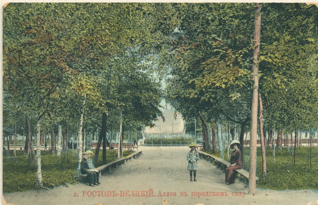
г. РОСТОВЪ-ВЕЛИКІЙ. Аллея въ городскомъ саду

В первой половине XIX века Ростовская ярмарка считалась третьей по обороту в России после Нижегородской и Ирбитской. Она обеспечивала «цветущее состояние городских доходов» более ста лет. Торговцы на нее приезжали из самых разных мест: Московской, Санкт-Петербургской, Костромской, Вологодской, Владимирской, Казанской, Астраханской, Нижегородской губерний, даже из Грузии и Армении.