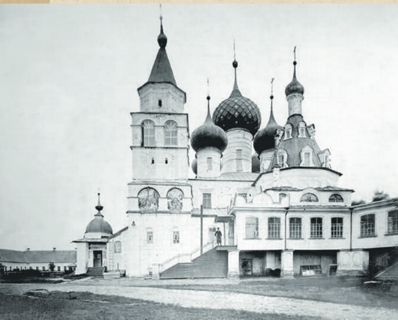
Богоявленский собор Авраамиева монастыря. На переднем плане — крытая галерея, соединявшая собор с Введенским храмом. Ныне утрачена. Фотография начала XX века

нонизирован он еще до знаменитых соборов 1547-го и 1549-го годов, когда при московском митрополите Макарии к лику святых было причислено множество русских подвижников.