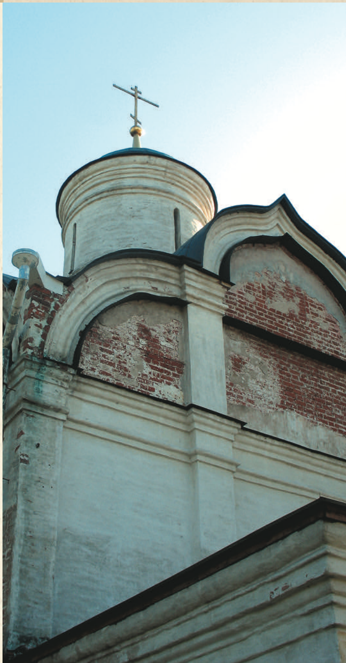
Вознесенский храм над гробом блаженного Исидора Твердислова

для себя блаженный выбрал топкое место, несколько возвышенное над водой, где и устроил себе шалаш из хвороста. Шалаш этот не имел крыши, так что он не защищал подвижника от непогоды, а только ограждал его от людских глаз. Здесь святой проводил ночи в молитвах, а днем ходил по городу, добровольно терпя насмешки и презрение от жителей.