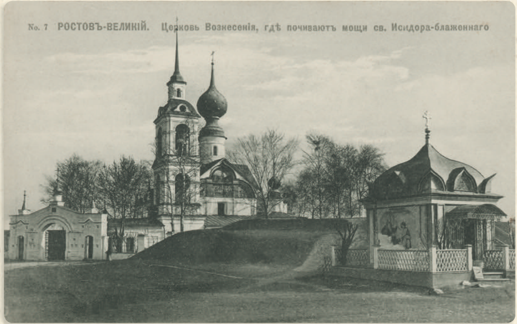
№ 7 РОСТОВЪ-ВЕЛИКИЙ. Церковь Вознесения, гдѣ почиваютъ мощи св. Исидора-блаженнаго

ухание. Привлеченные им жители узнали, что не стало юродивого, которого за истинность предсказаний они называли Твердисловом. Погребен он был через несколько дней в навечерие Вознесения Господня, поэтому деревянный храм, построенный вскоре на месте его хворостяного жилища, освятили в честь этого великого праздника.