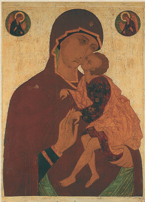
Храмовая икона Божией Матери «Одигитрия-Ростовская». Первая половина XVI века