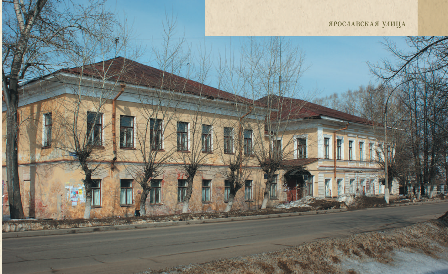
Ярославская улица, 21–23

хлеба, например бородинском, рижском. Кроме того, применяется для подслащивания ликеров, наливок и придания им густоты.